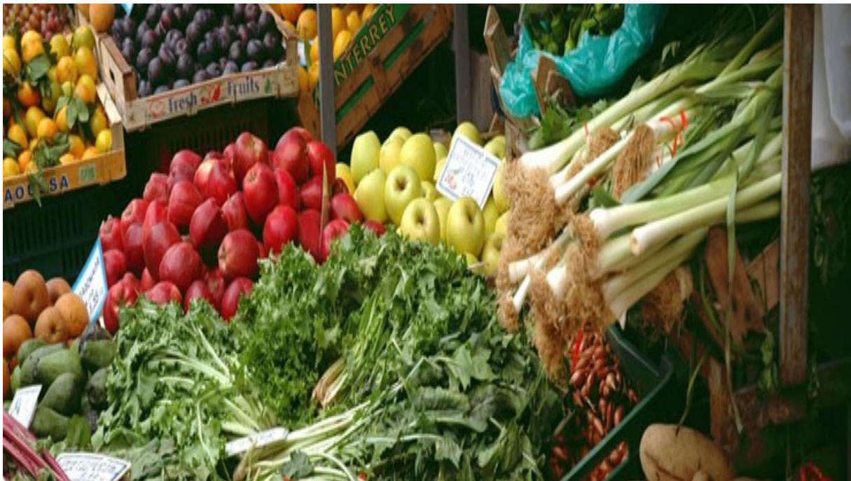
Abb.: Wochenmarkt in Neusäß