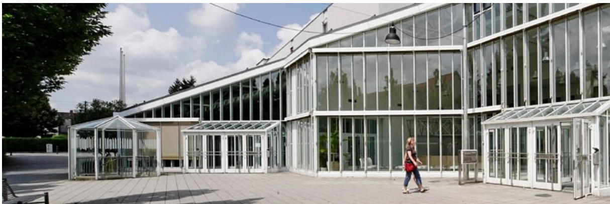
Abb.: direkt gegenüber der Hauptstraße 19 ist das Rathaus mit der Stadthalle und Tiefgarage