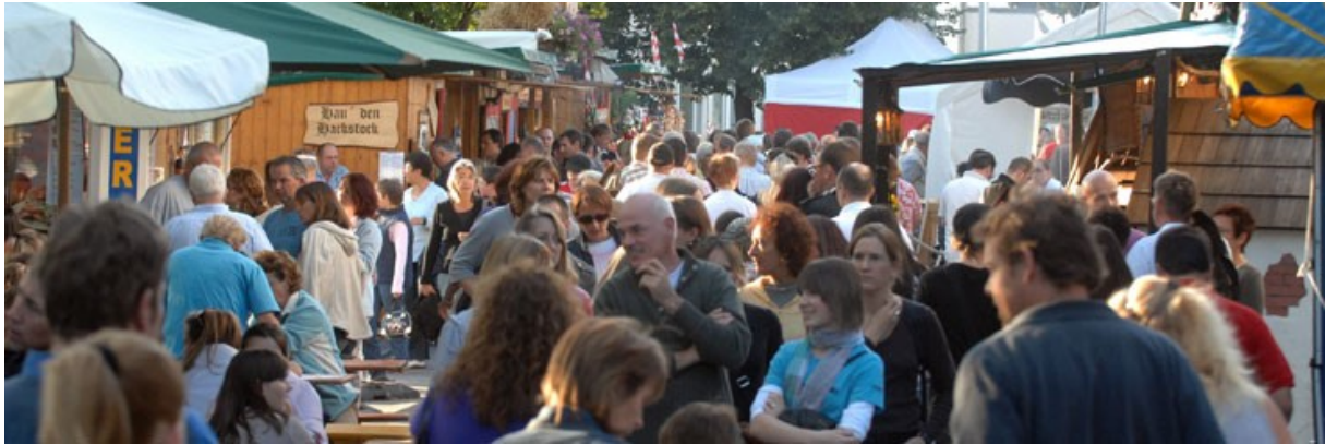
Abb.: Volksfest in Neusäß