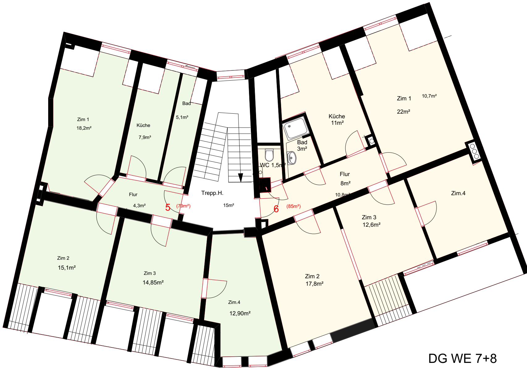
DG WE 7+8