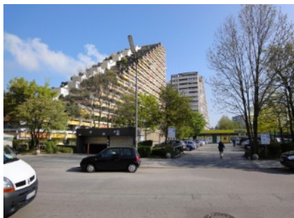
Das Pharaohaus mit Läden im EG und TG-Einfahrt