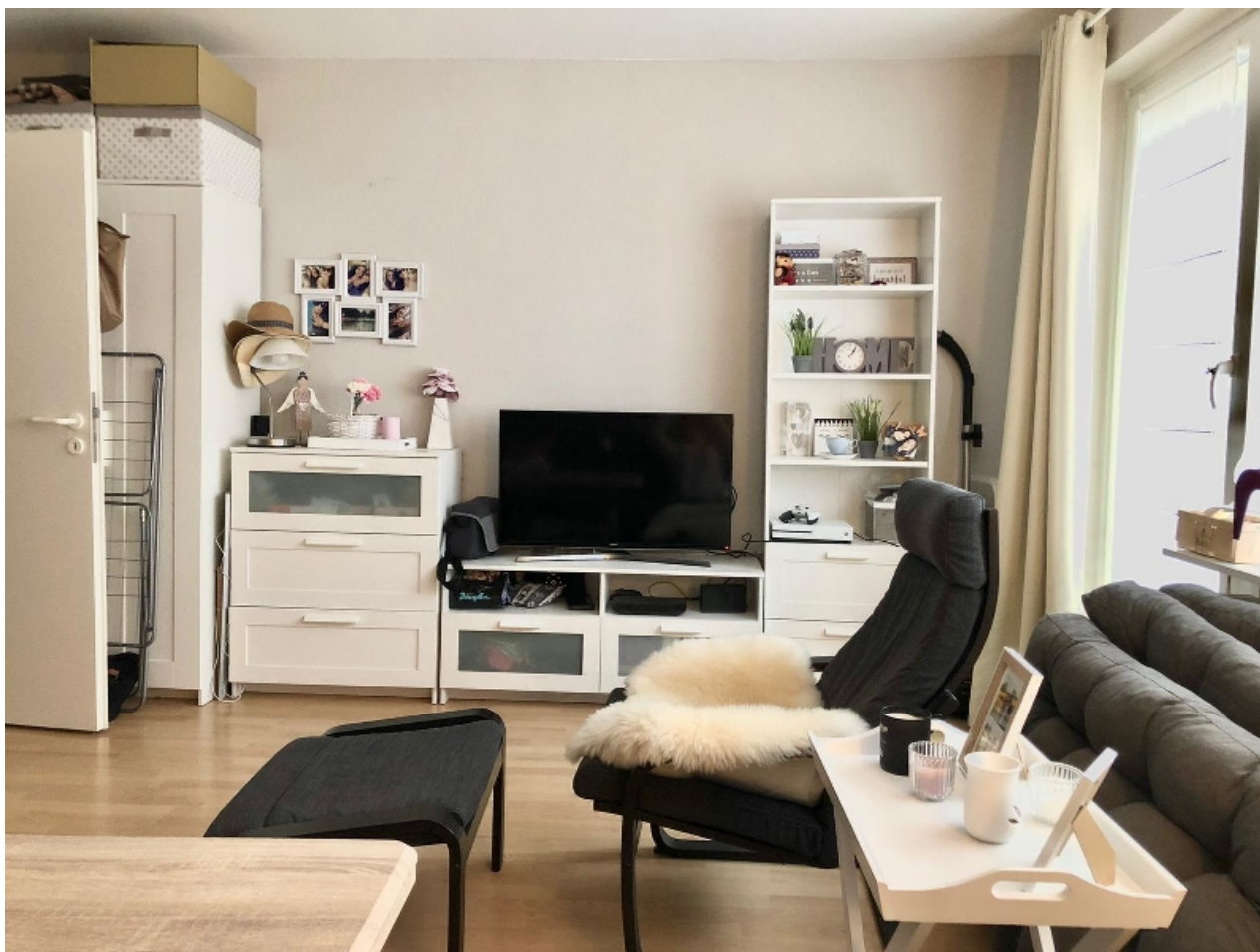
Wohnzimmer, Farb- und Einrichtungsmöglichkeit