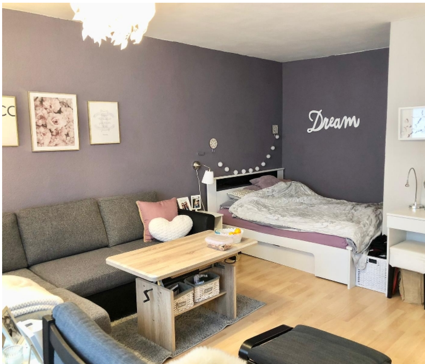
Wohnzimmer, Farb- und Einrichtungsmöglichkeit