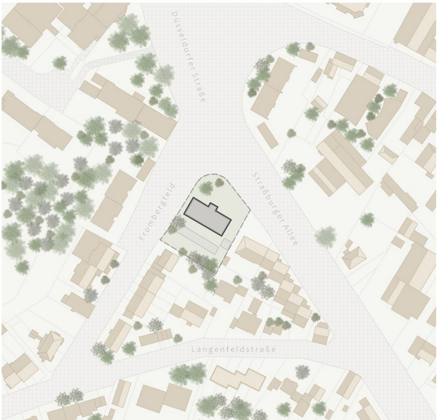
Lageplan genordet M1:1500

Die angebotene Eigentumswohnung befindet sich in einer der begehrtesten Lagen von Mülheim an der Ruhr, im charmanten Stadtteil Saarn. Dieser Stadtteil überzeugt durch seinen Altstadtcharme und die perfekte Kombination aus Urbanität und Erholungsmöglichkeiten. Die zentrale Lage bietet eine ausgezeichnete Infrastruktur, die sowohl für Kapitalanleger als auch für Mieter einen echten Mehrwert darstellt.