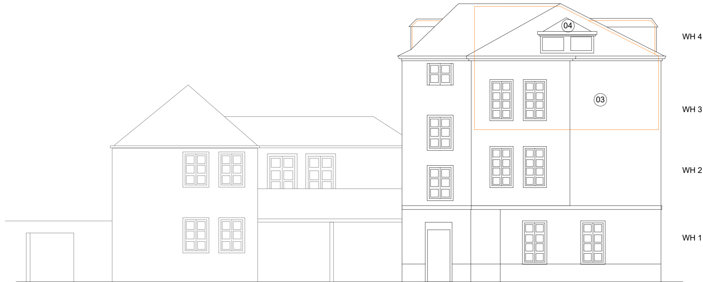
WEST-ANSICHT ZELLSTRASSE 1:100

"Diese Pläne dienen ausschließlich der Eigentumsteilung und sind nicht für bauliche Maßnahmen bestimmt."