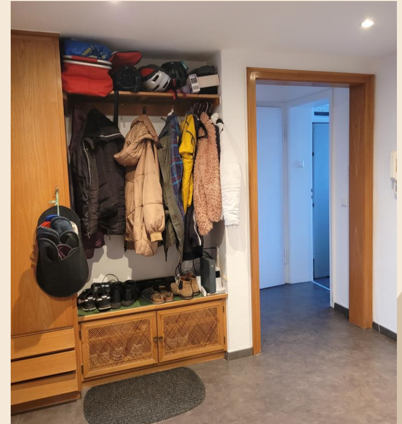
Flur mit Einbau-Garderobe