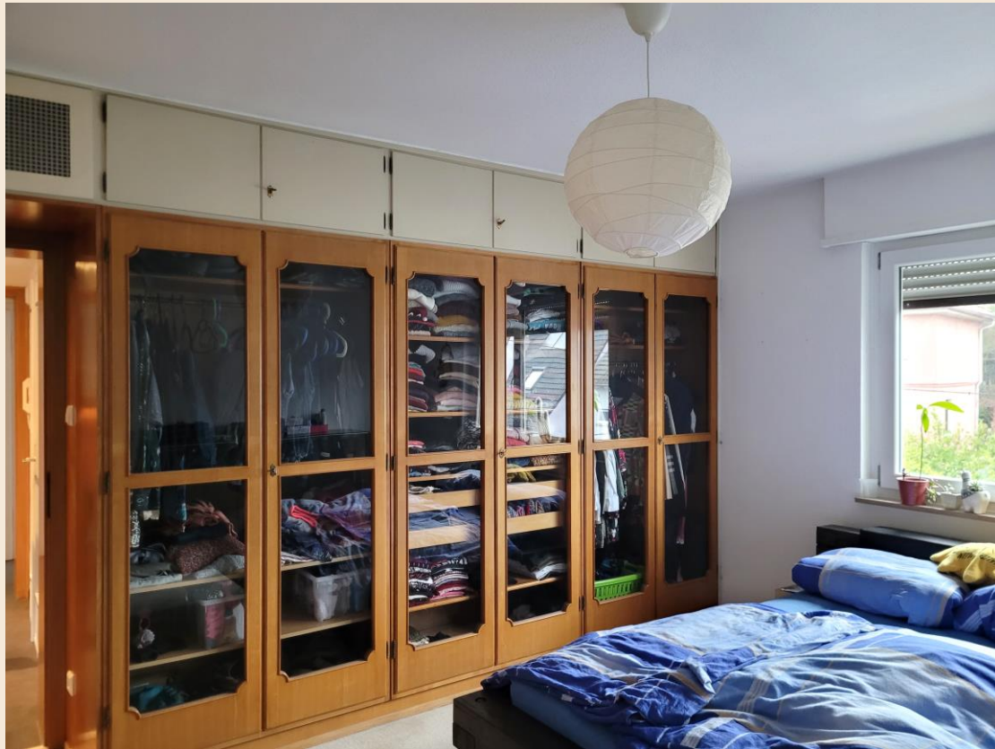
Zimmer 3 mit Einbau-Kleiderschrank