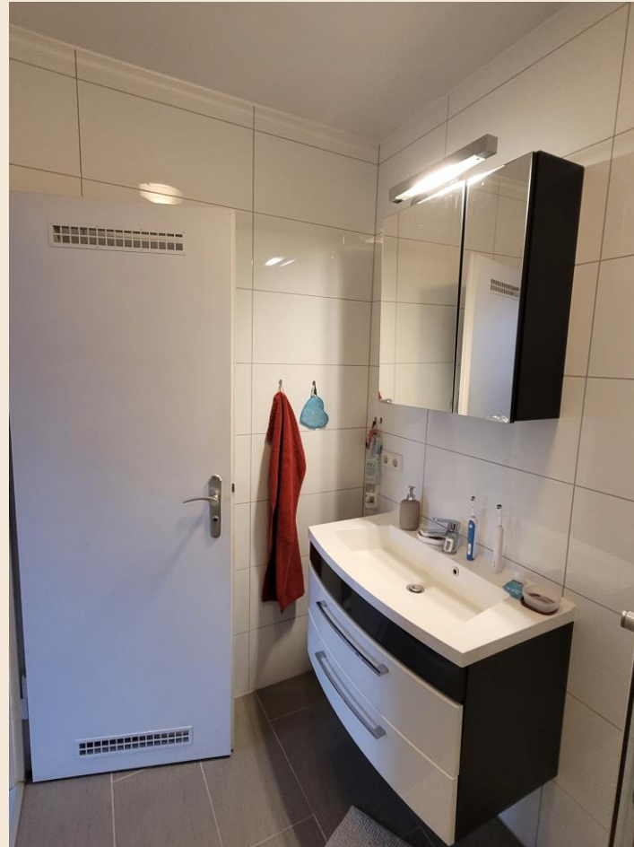
Bad Blick zur Türe