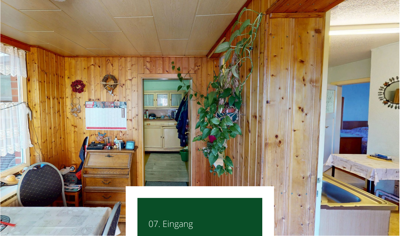
07. Eingang 08. Esszimmer