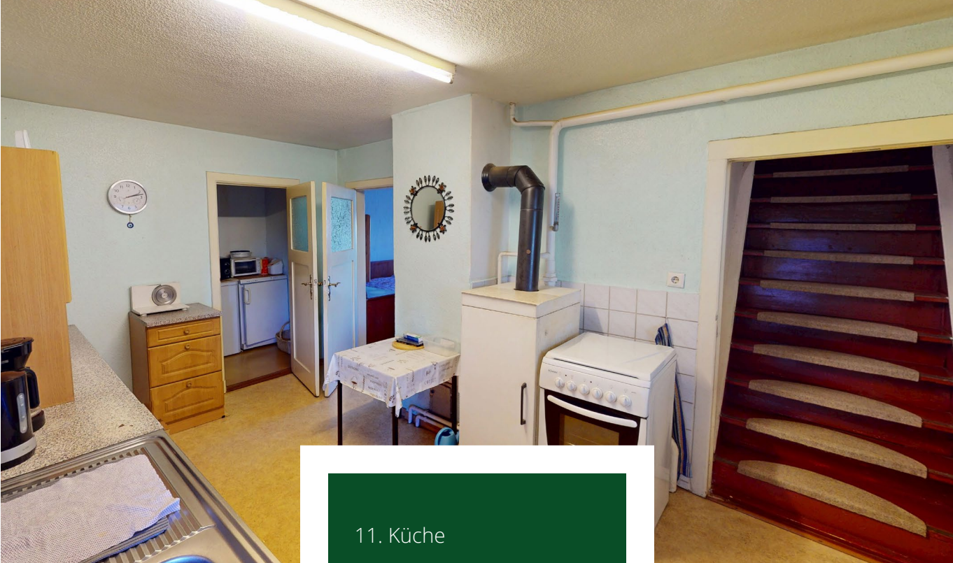
11. Küche 12. Schlafzimmer