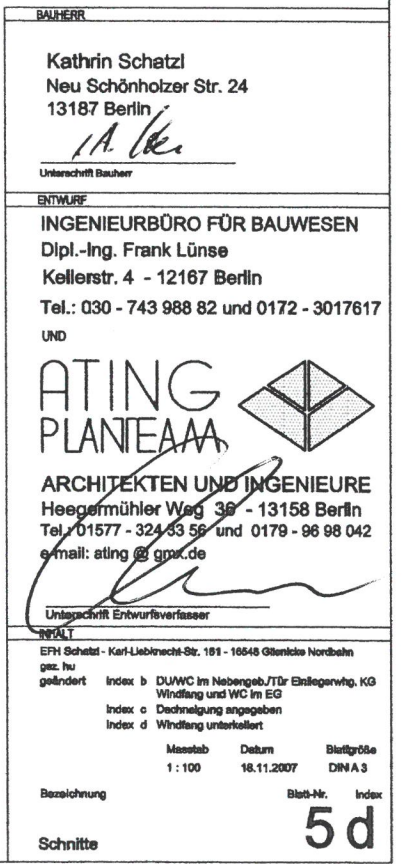
SCHNITTE - M 1:100

Bauantragszeichnungen nach einem Entwurf von Architekt Juergen Engel - Kiel