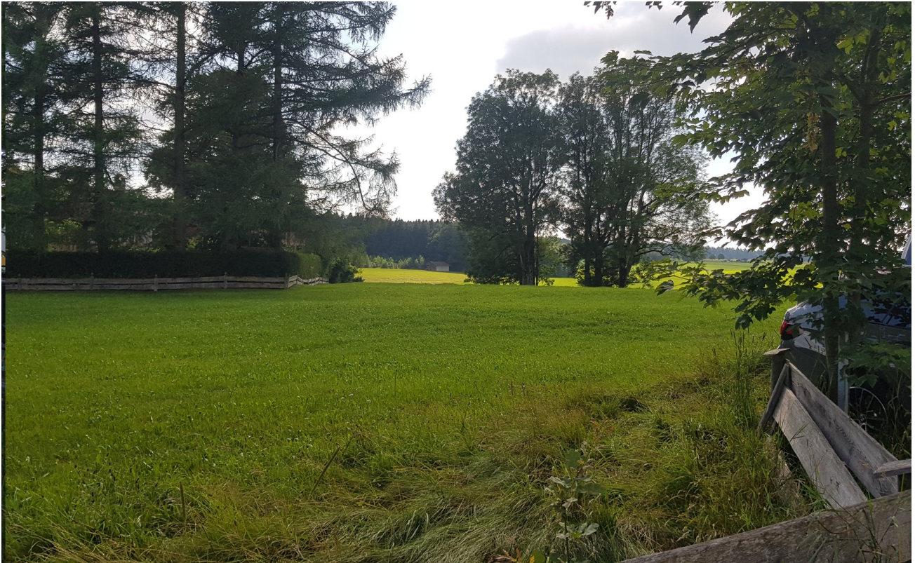
Unverbauter Blick ins Grüne