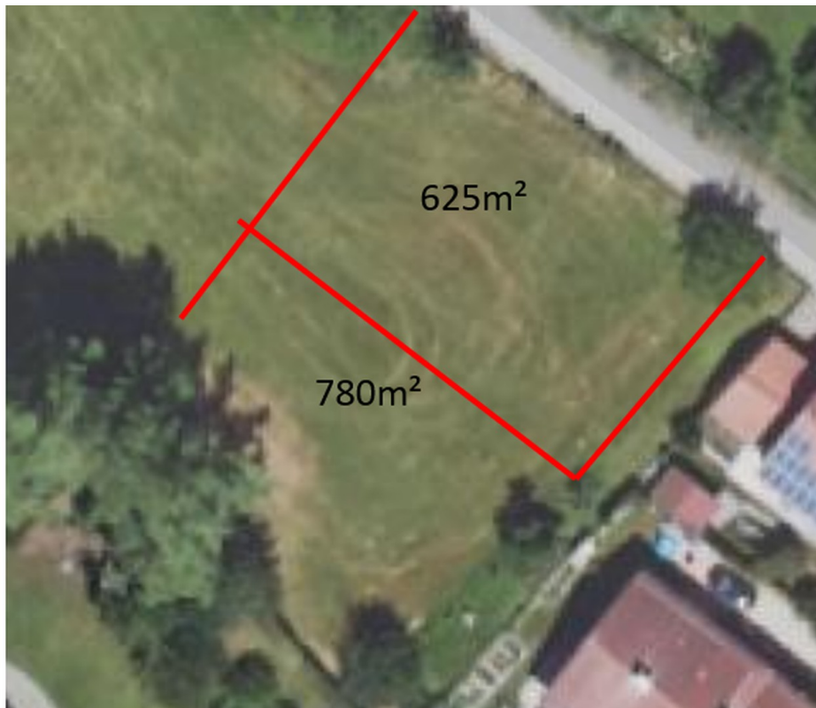
Aufteilung in 2 Grundstücke