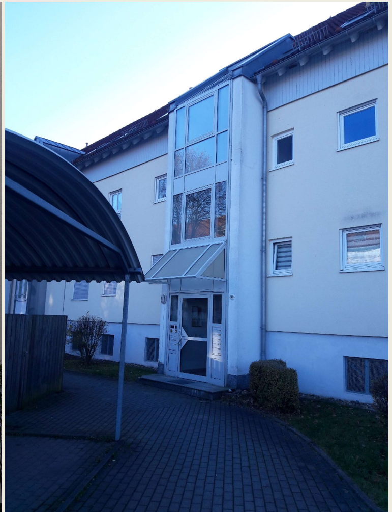
Ansicht der Wohnanlage Eingangsbereich

Eigentümer: L.& I. Kegel <luikegel@mail.de>