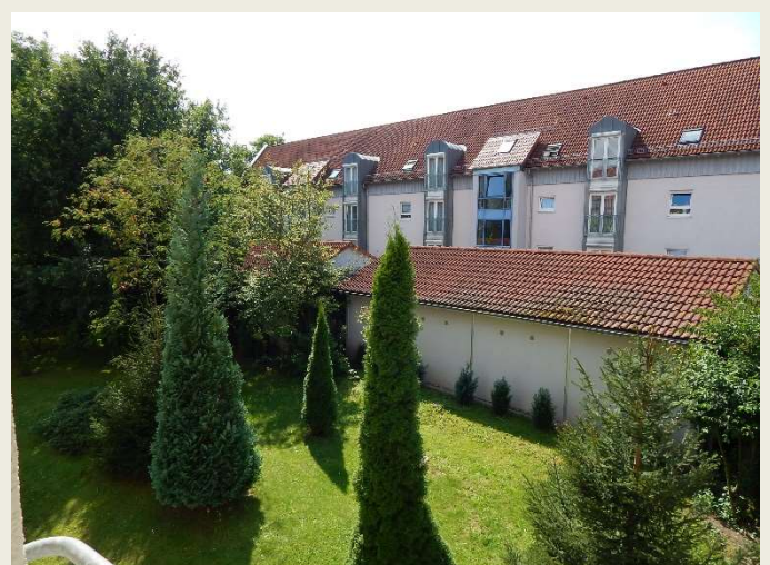
Ansicht vom Balkon aus