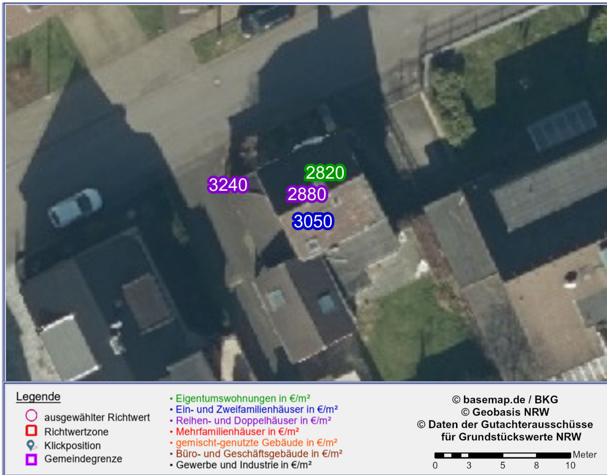
Abbildung 1: Detailkarte gemäß gewählter Ansicht