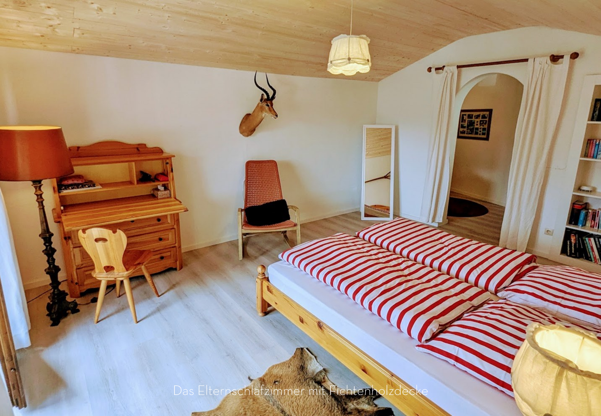
Das Elternschlafzimmer mit Fichtenholzdecke