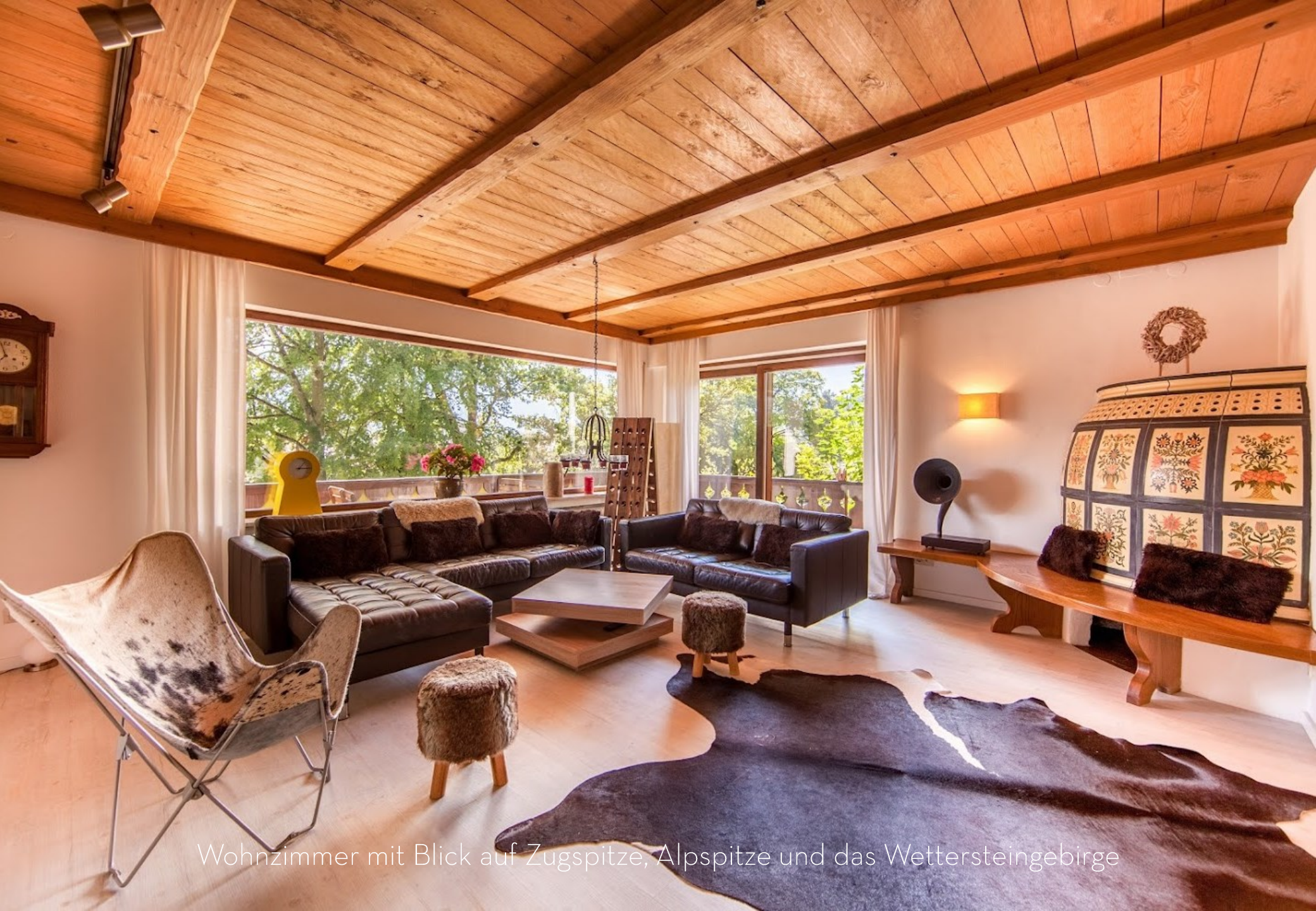
Wohnzimmer mit Blick auf Zugspitze, Alpspitze und das Wettersteingebirge