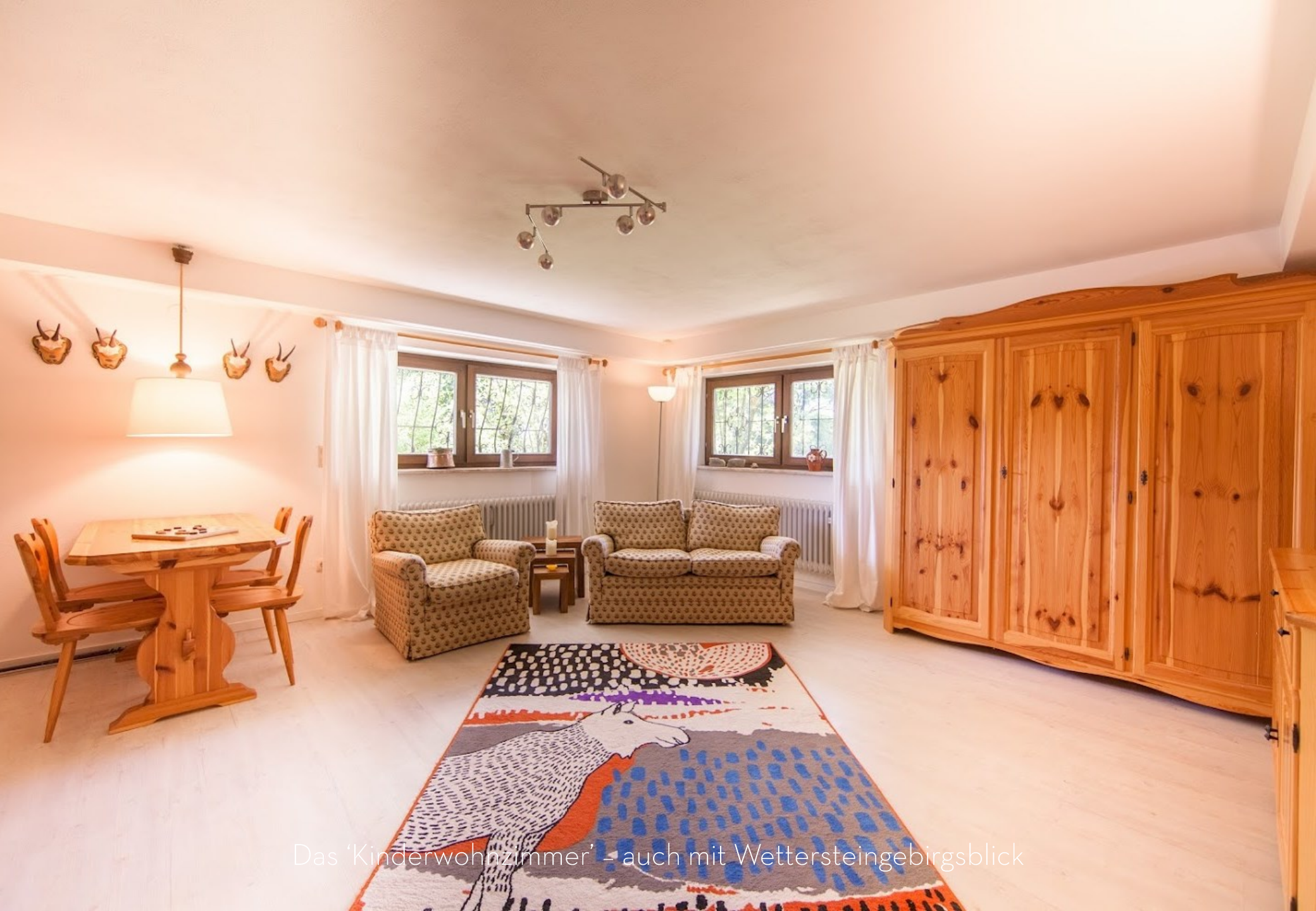
Das 'Kinderwohnzimmer' - auch mit Wettersteingebirgsblick