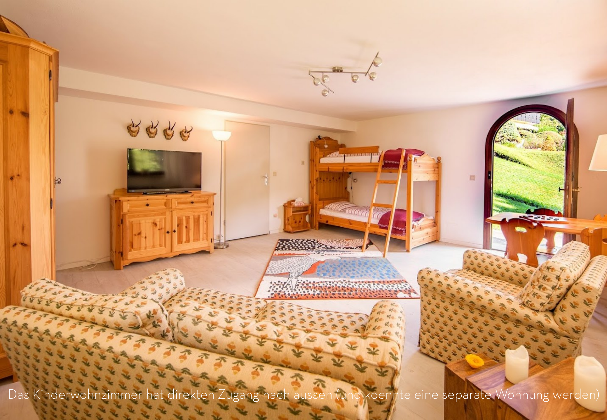
Das Kinderwohnzimmer hat direkten Zugang nach aussen (und koennte eine separate Wohnung werden)