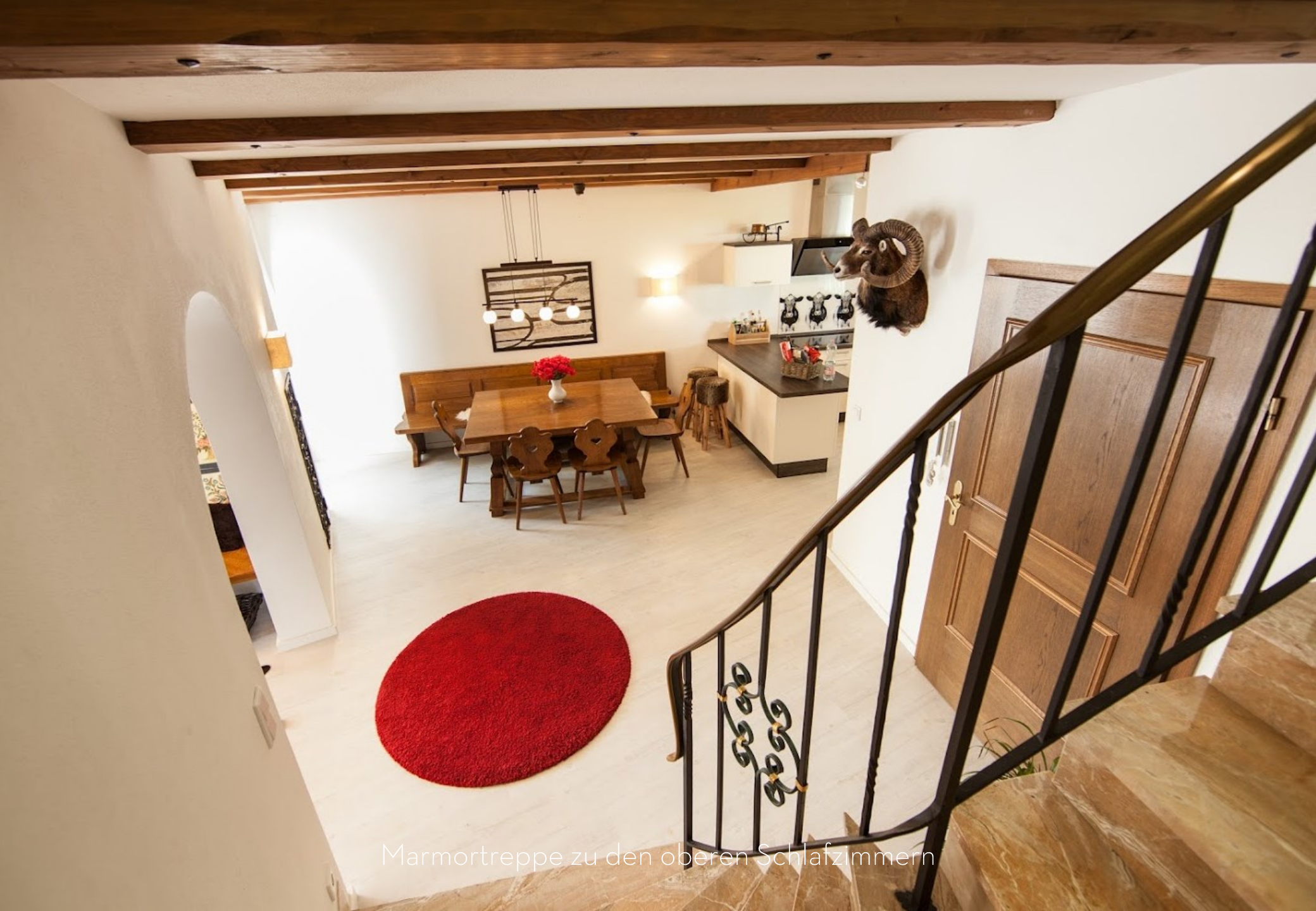
Marmortreppe zu den oberen Schlafzimmern