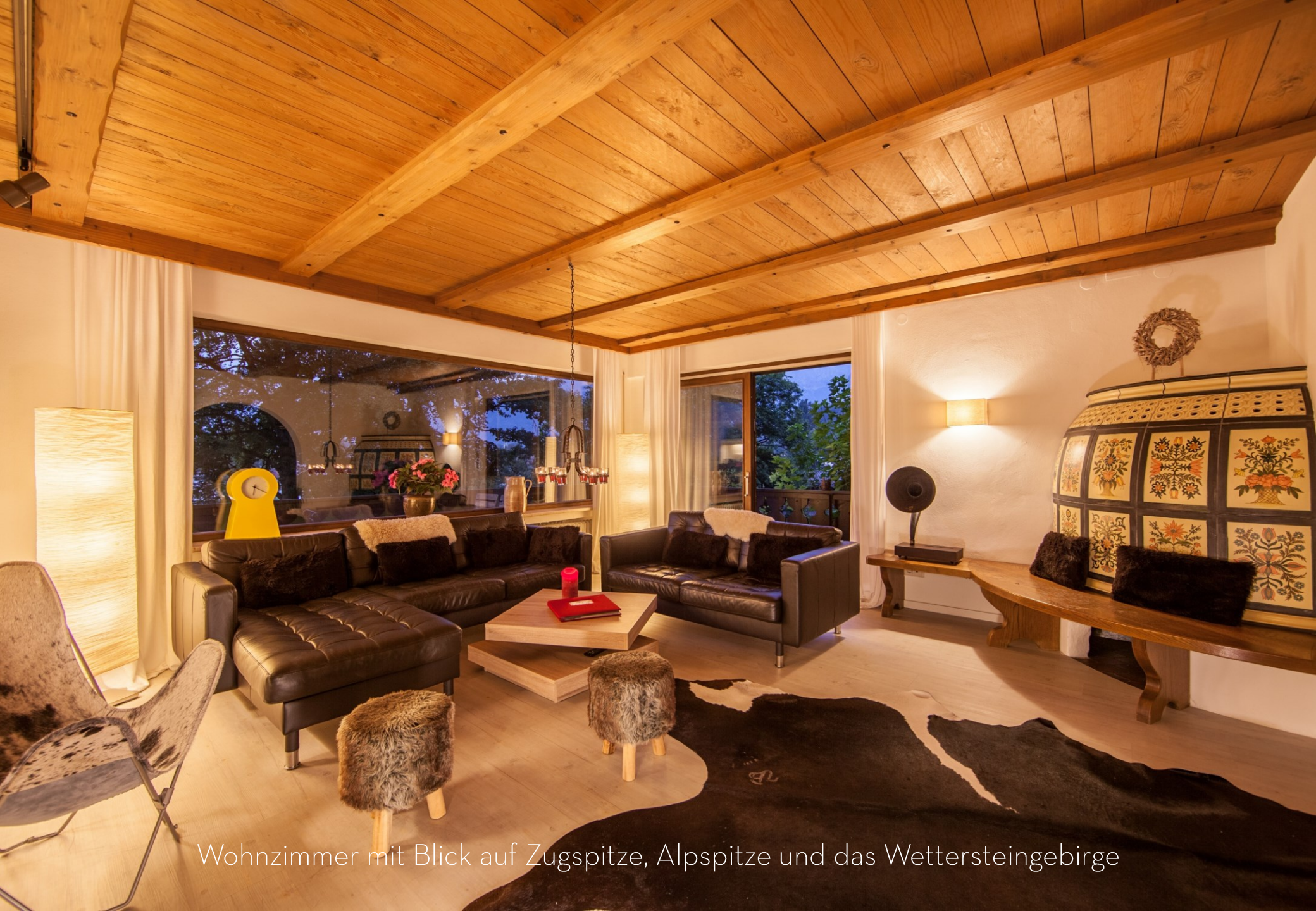
Wohnzimmer mit Blick auf Zugspitze, Alpsee und das Wettersteingebirge