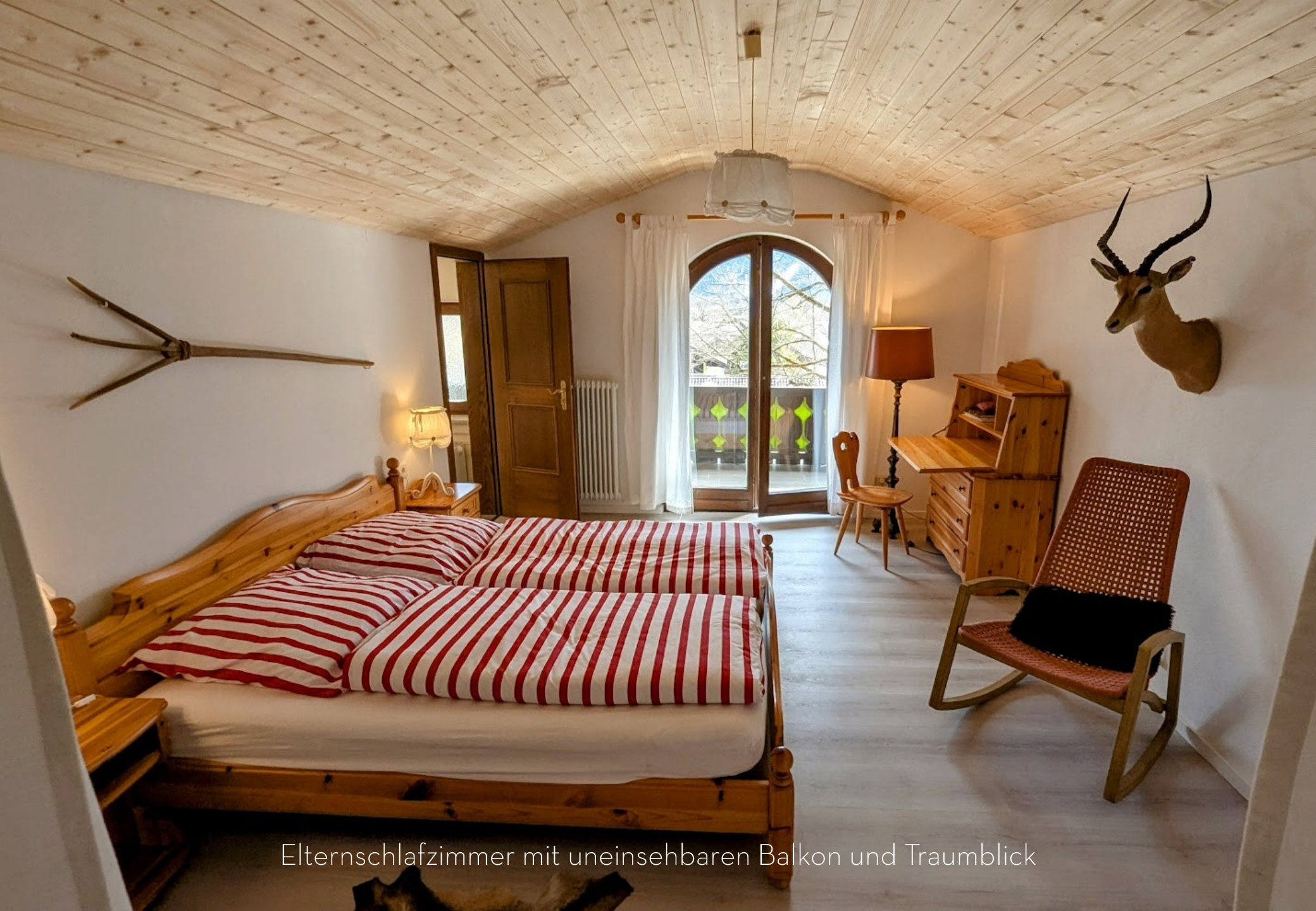
Elternschlafzimmer mit uneinsehbaren Balkon und Traumblick