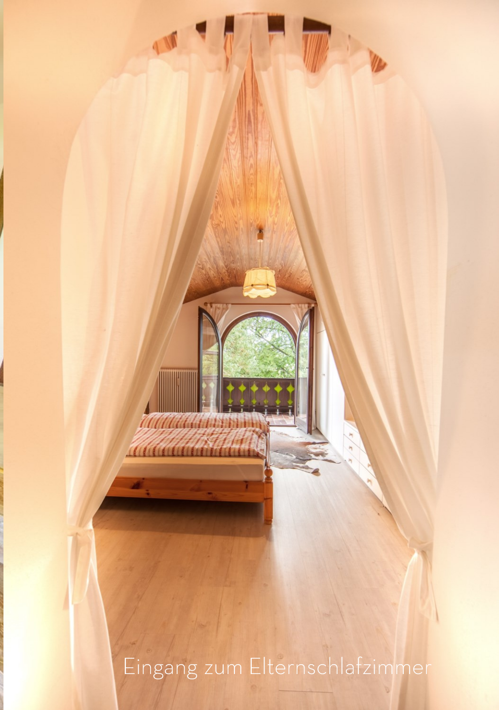
Eingang zum Elternschlafzimmer