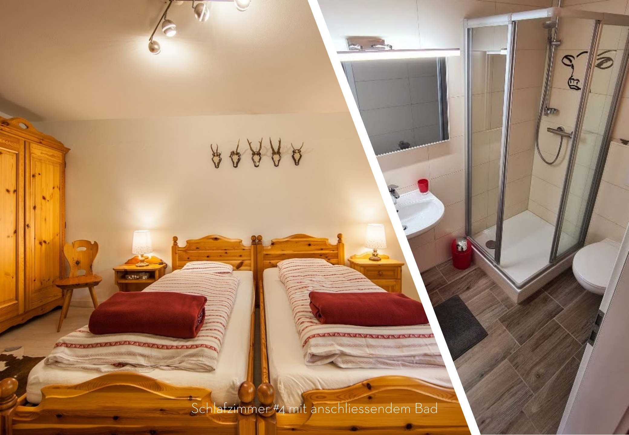
Schlafzimmer #4 mit anschliessendem Bad