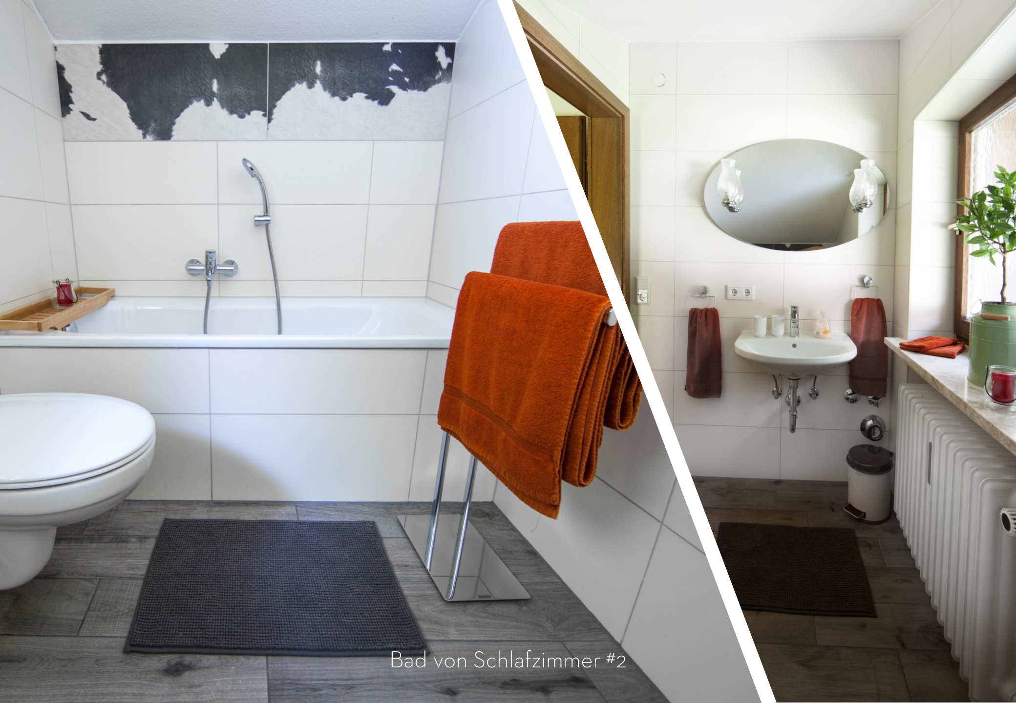
Bad von Schlafzimmer #2