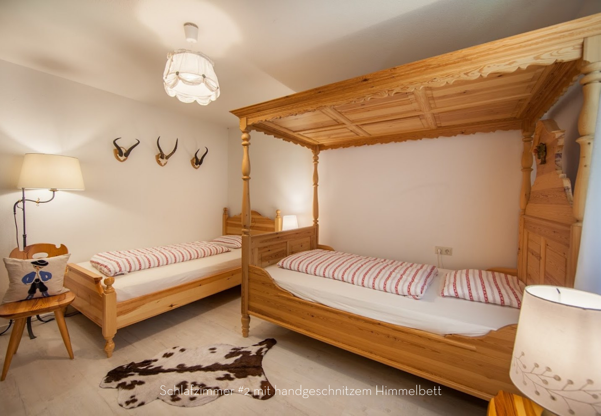
Schlafzimmer #2 mit handgeschnitztem Himmelbett