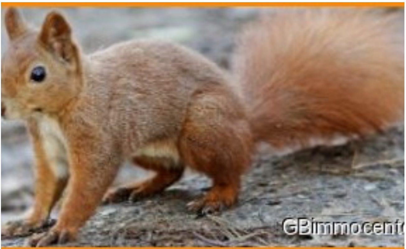
Nussknacker schon da