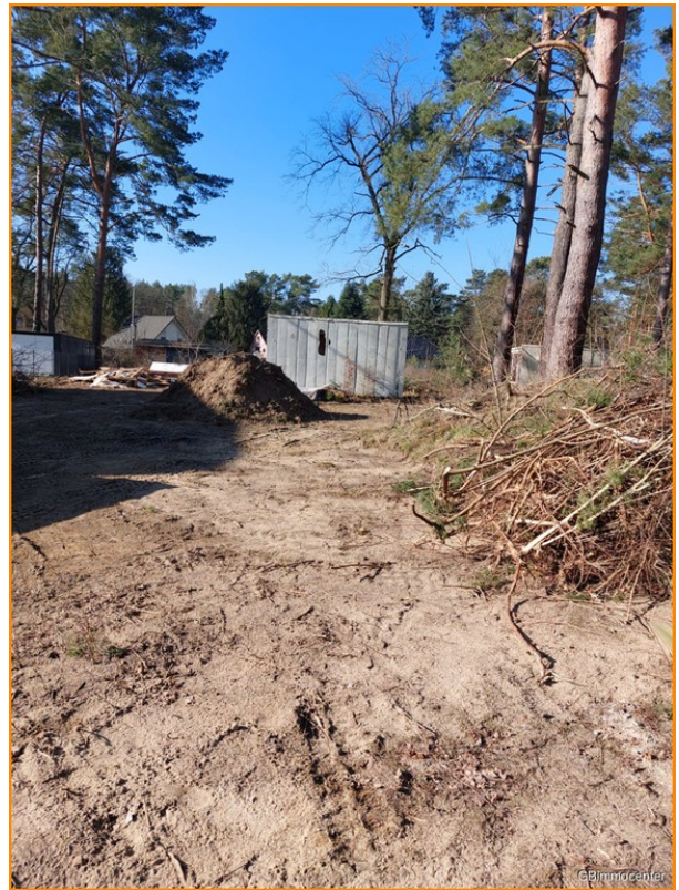
Hier geht es los