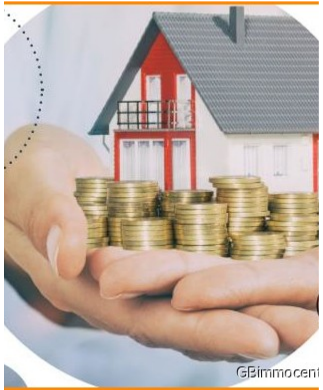
Fin. f Haus