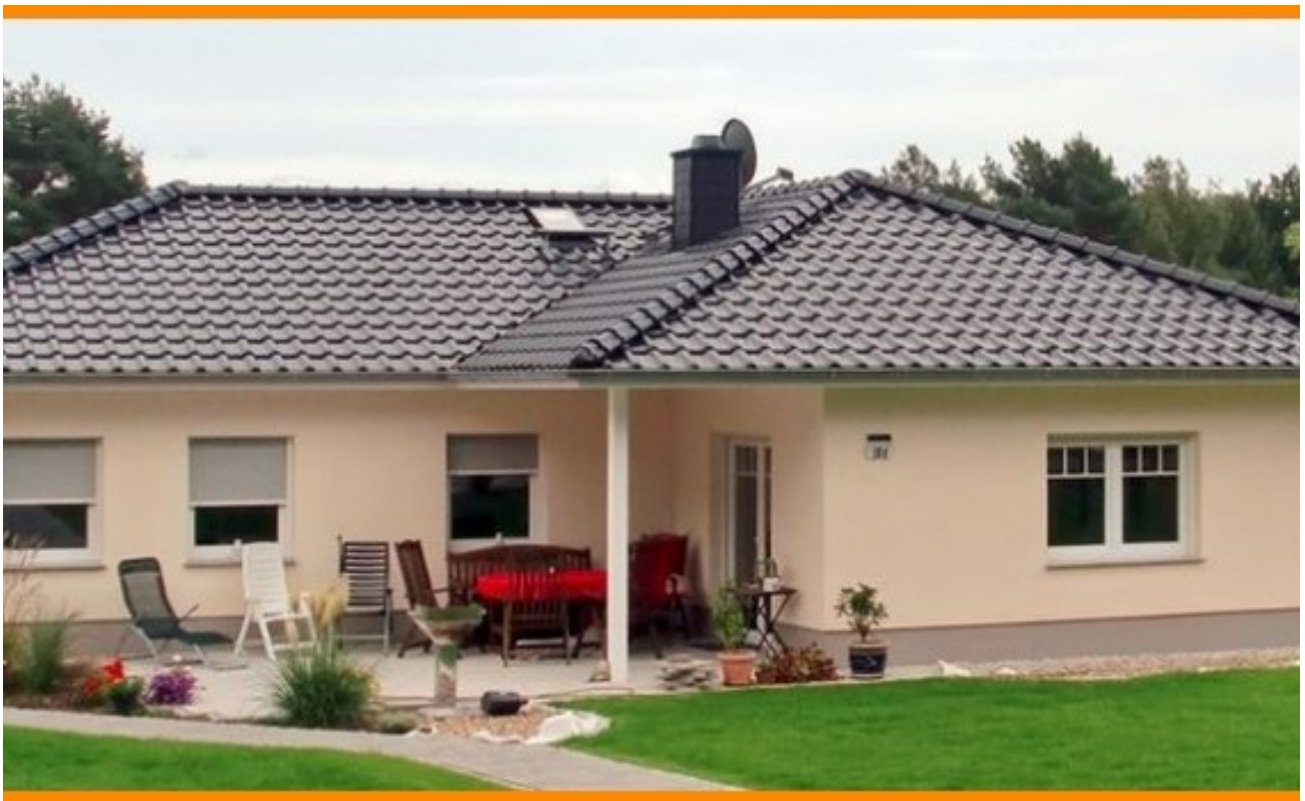
Ihr Bungalow 140