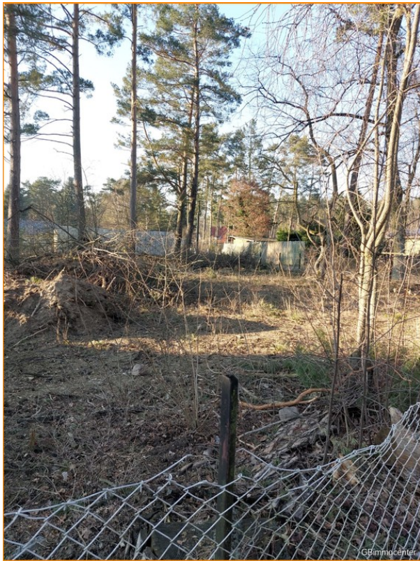
Das ist es .....