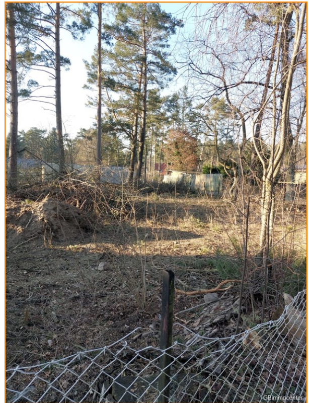
Das ist es .....