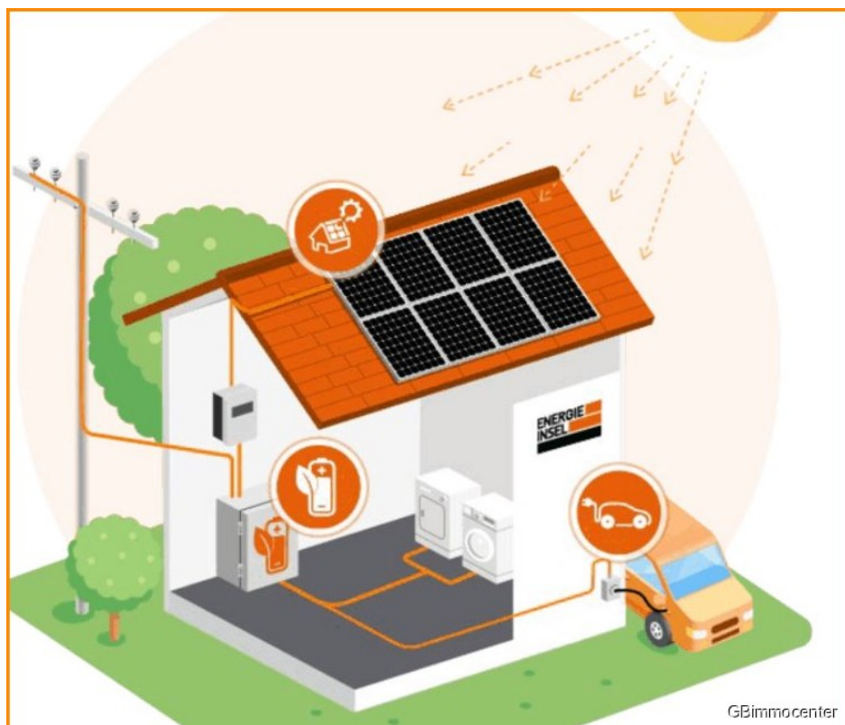
Stromdach PV möglich