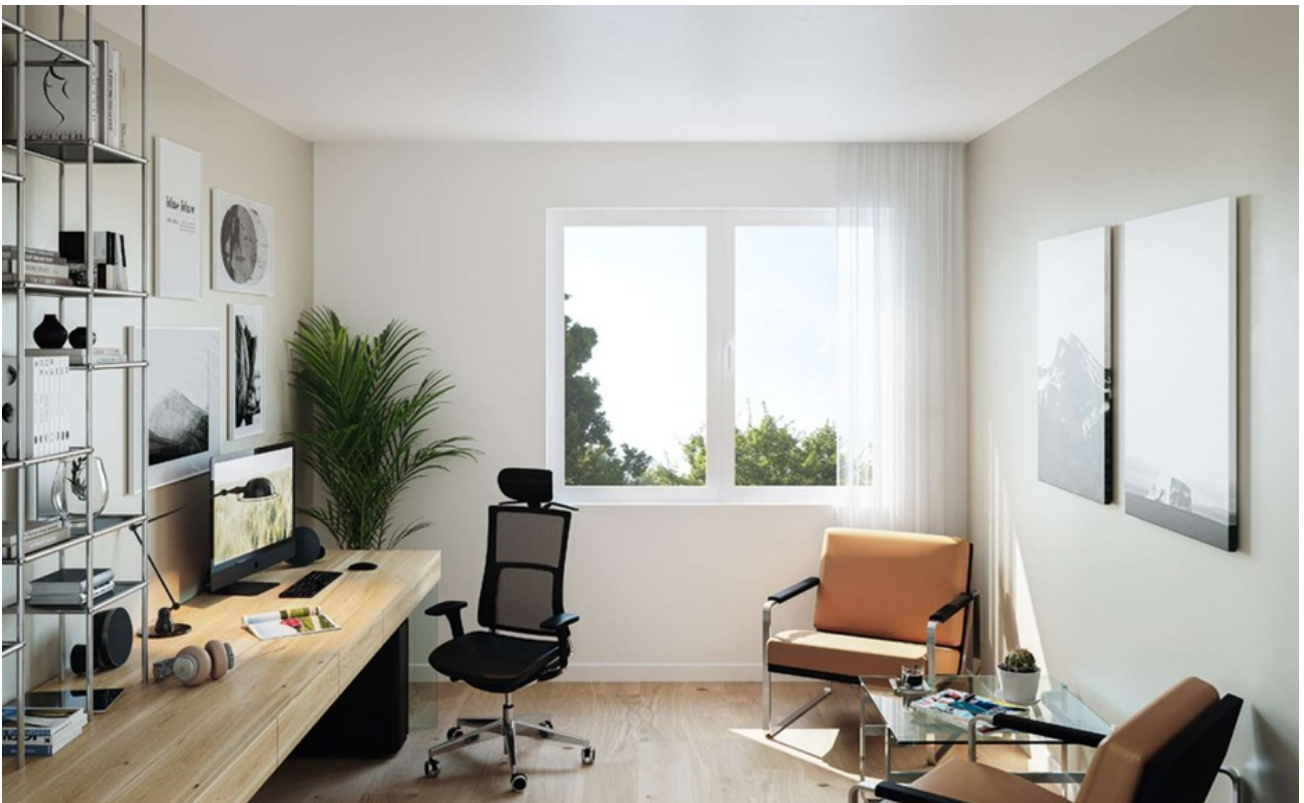
Arbeitszimmer Wohnung 4