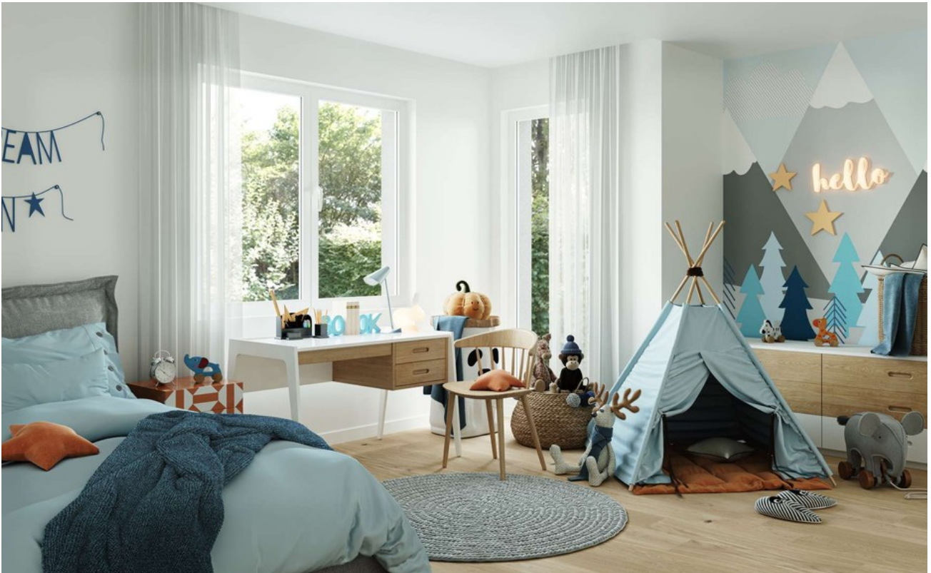
Kind Wohnung 1 Erdgeschoss