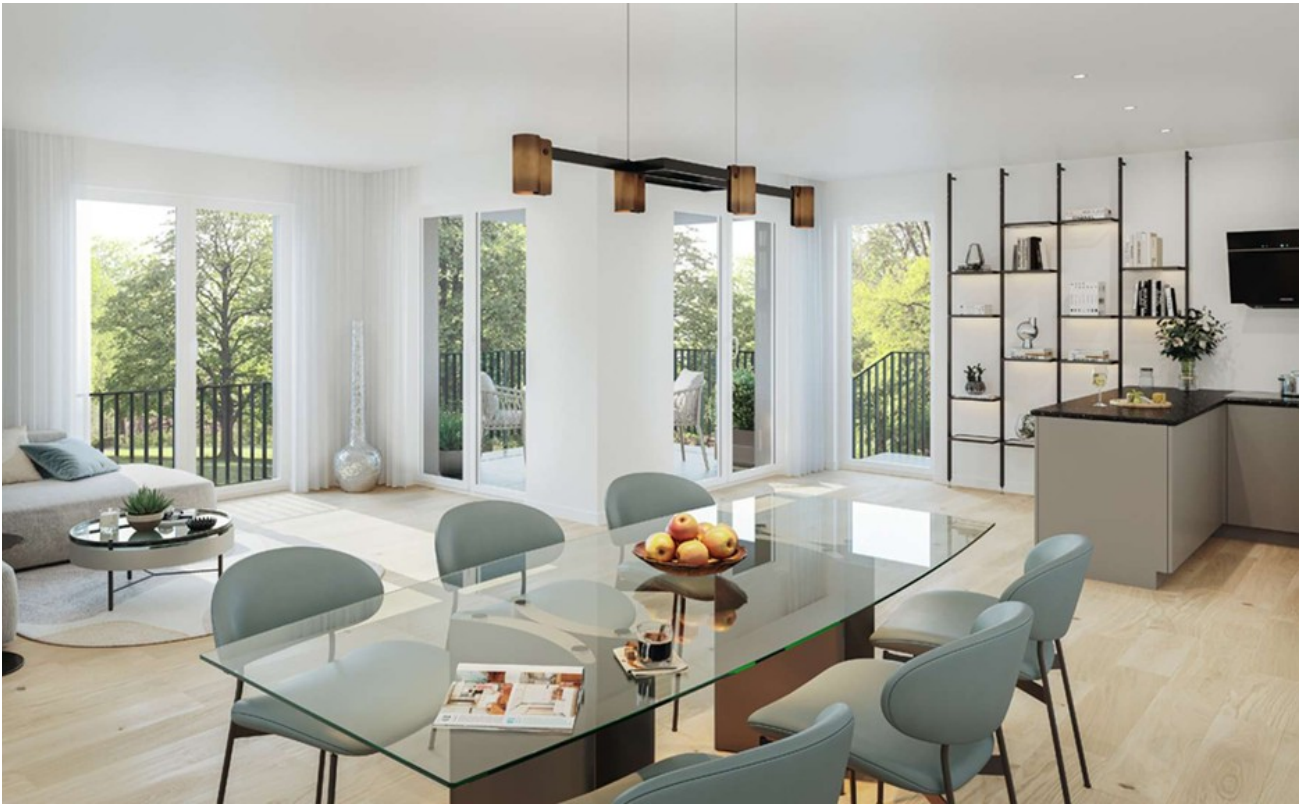
Wohn-Essbereich Wohnung 1