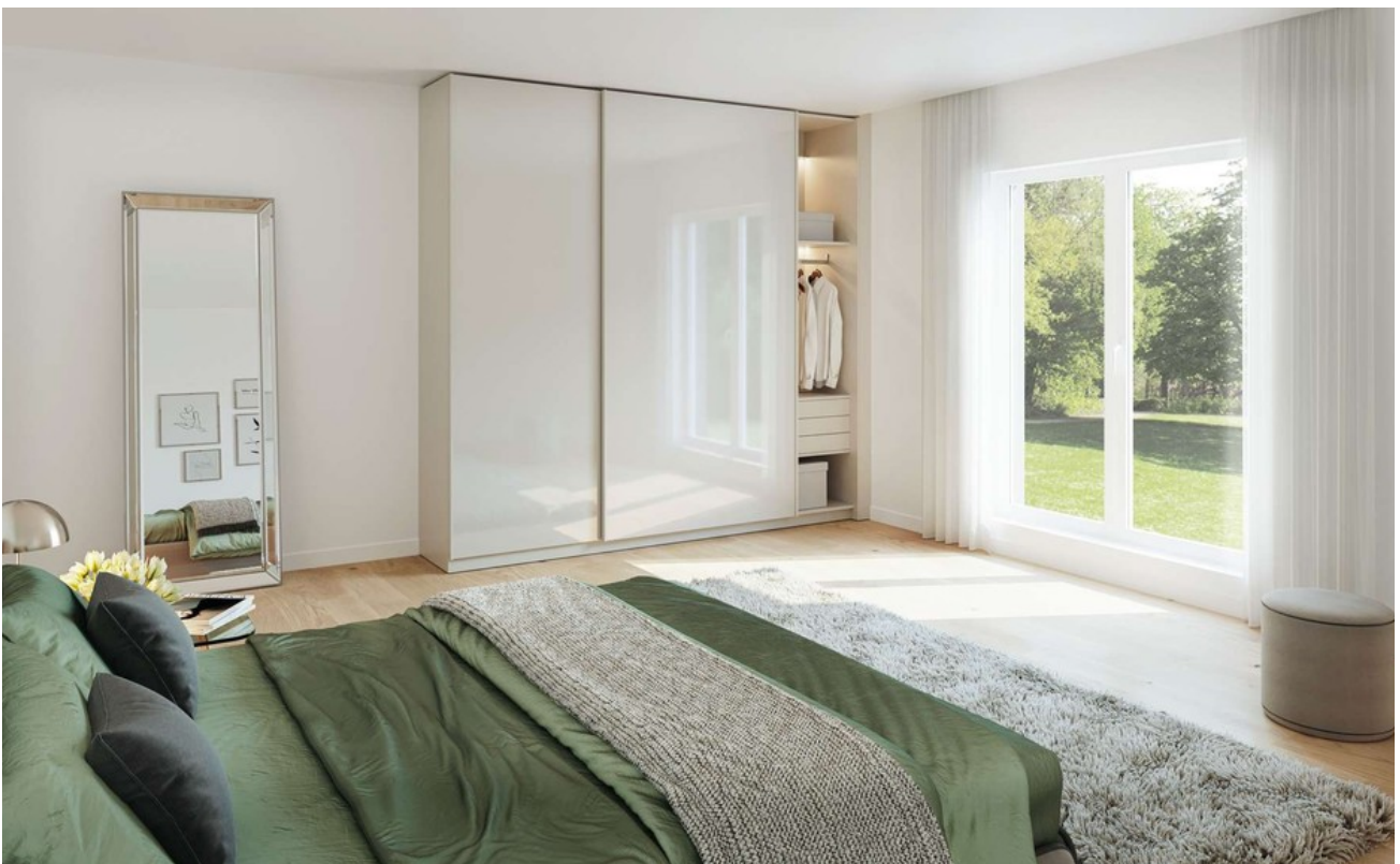
Schlafen Wohnung 1 Gartengesch