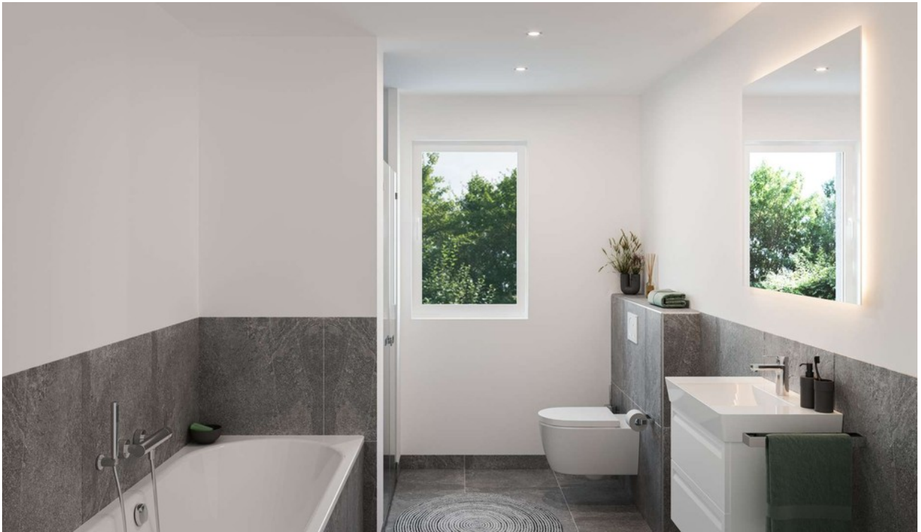
Badezimmer Wohnung 4