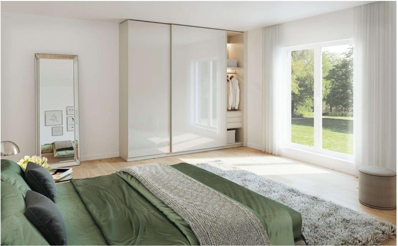
Schlafen Wohnung 1 Gartengesch