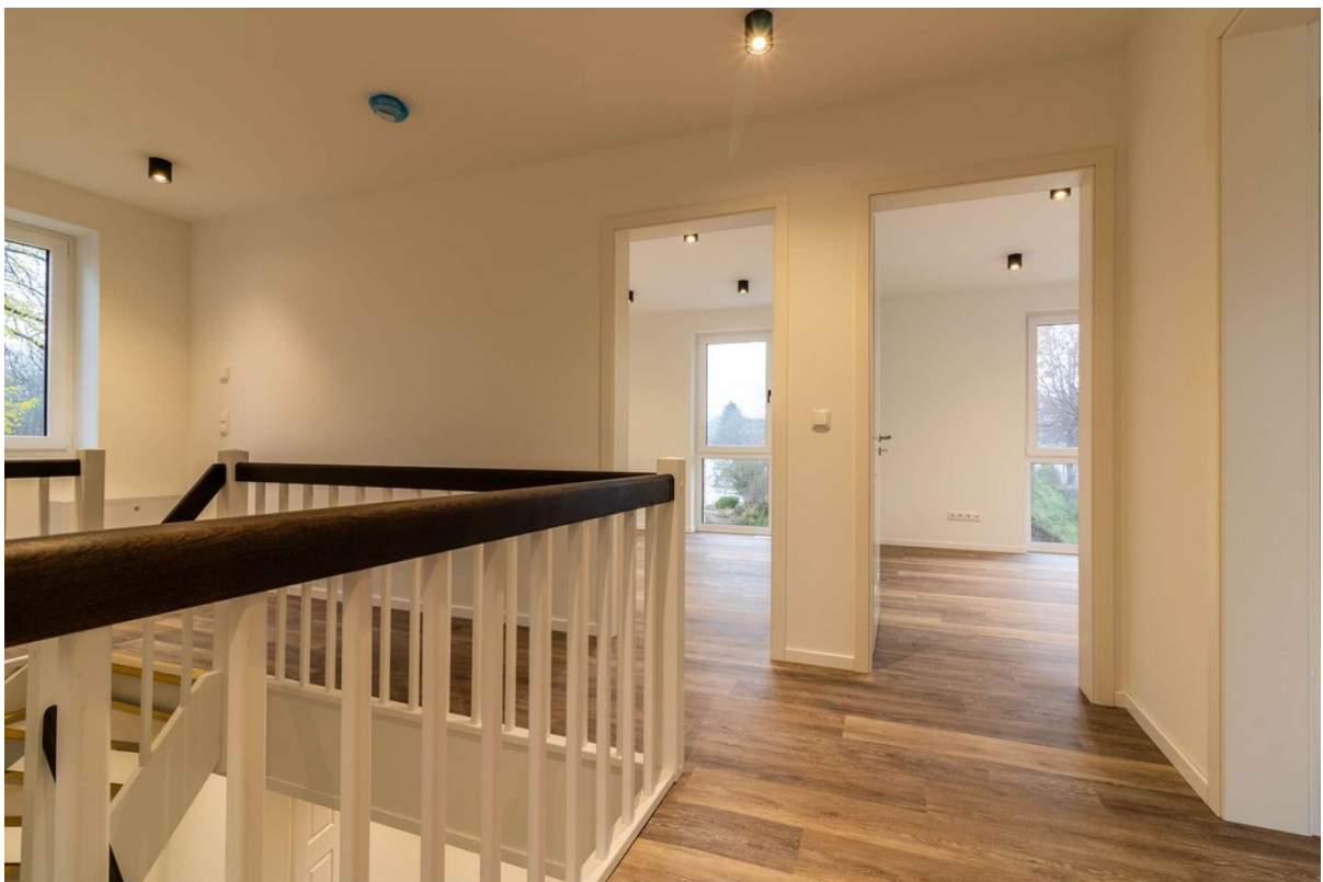
Flur im OG