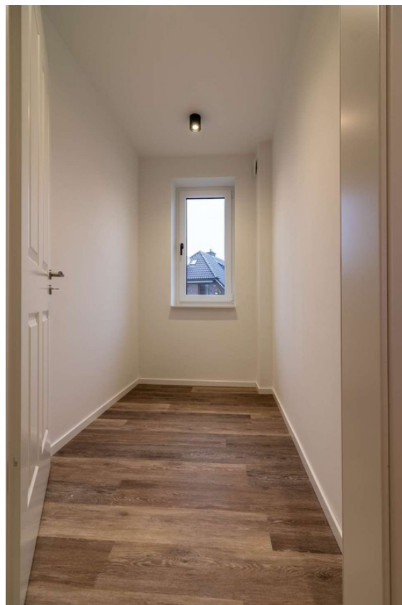
Abstellraum im OG