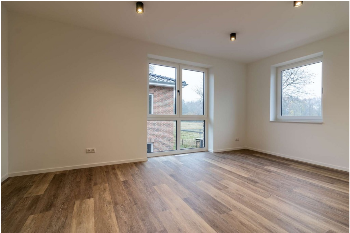
Zimmer 3 im OG