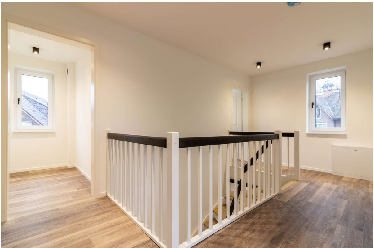
Flur im OG