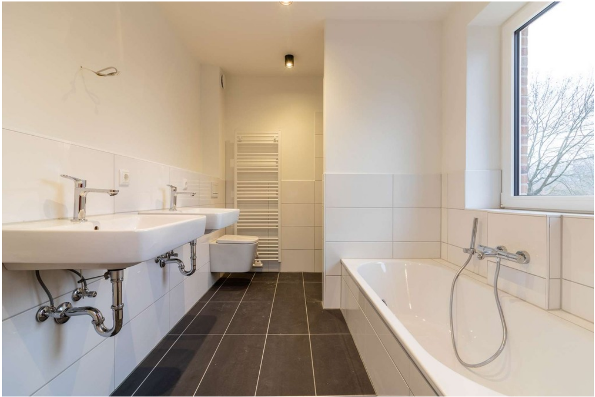
Wannen- / Duschbad im OG