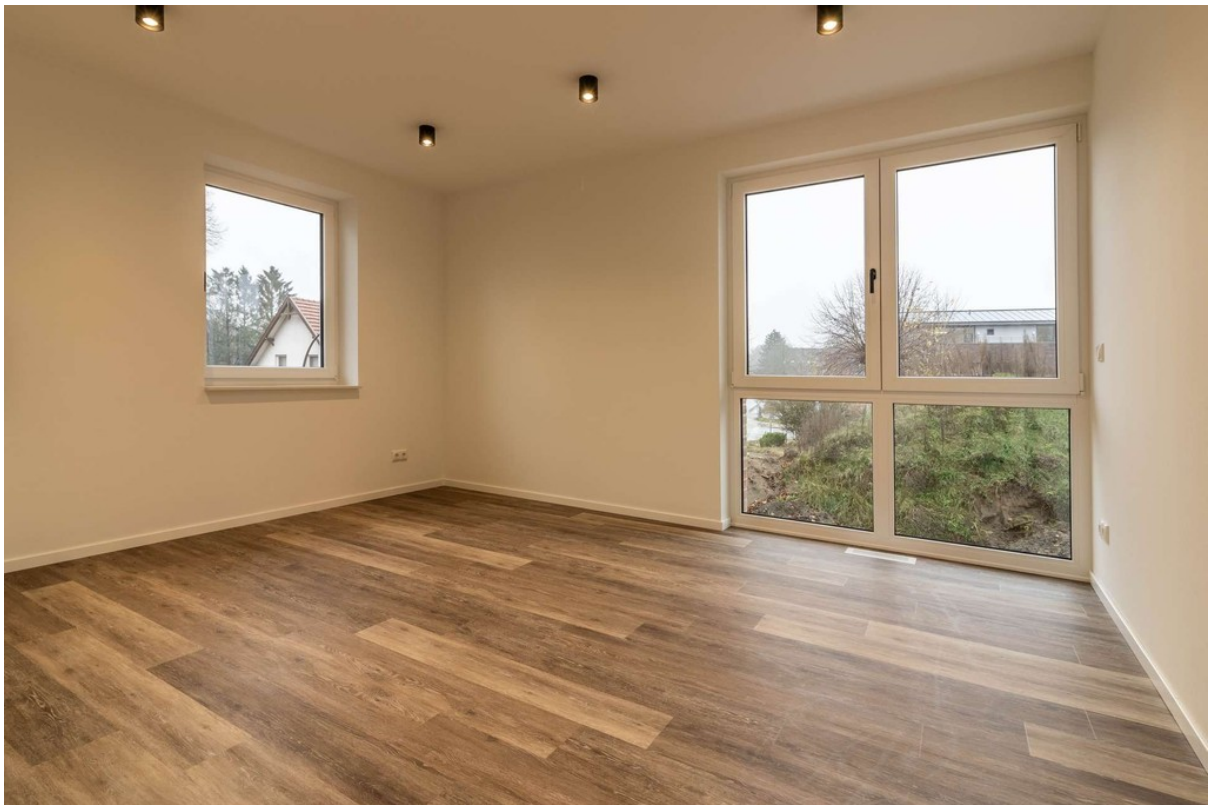
Zimmer 1 im OG