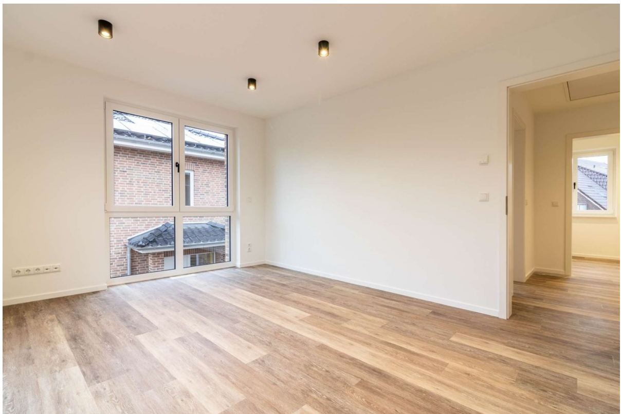
Zimmer 2 im OG