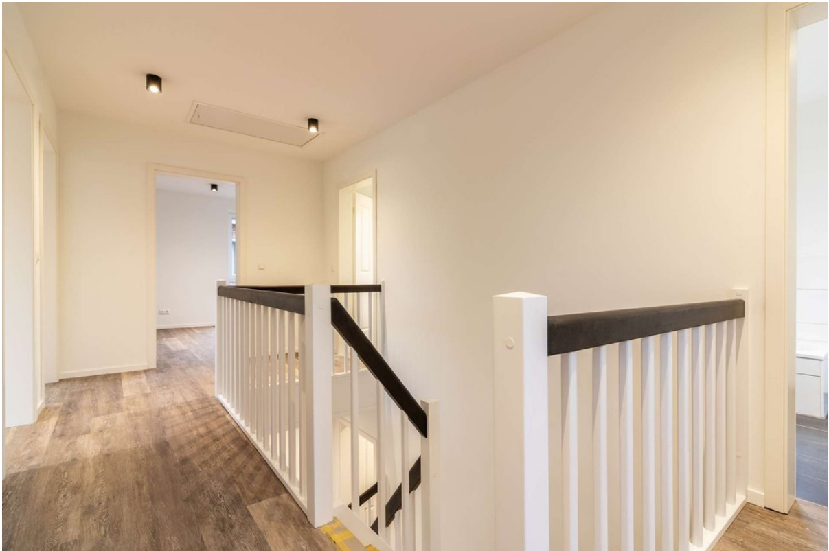
Flur im OG