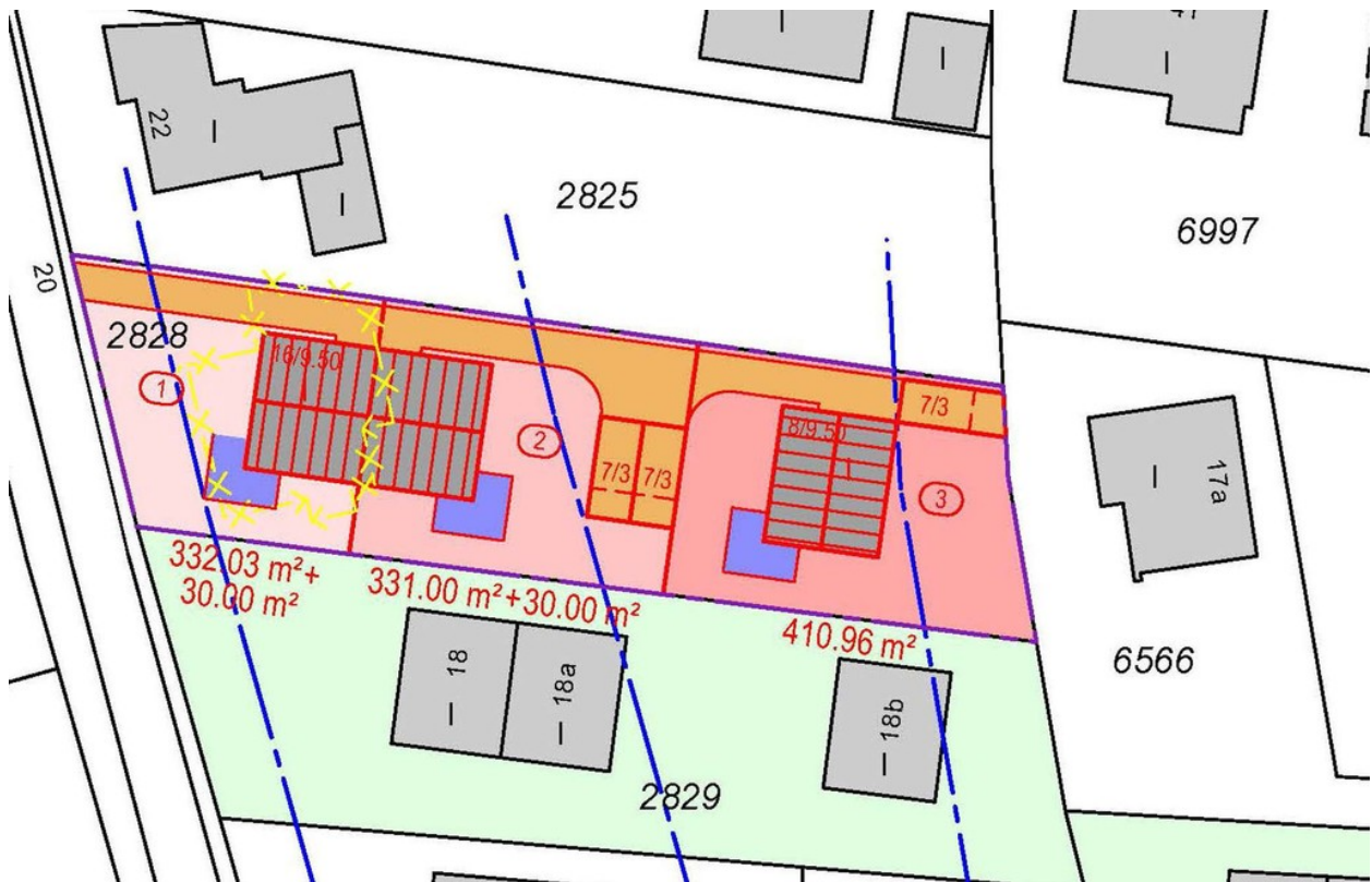
Lageplan für Teilung