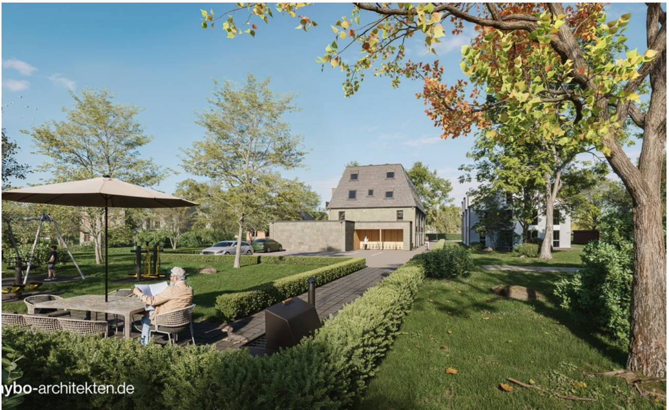
Rückansicht mit gem. Garten