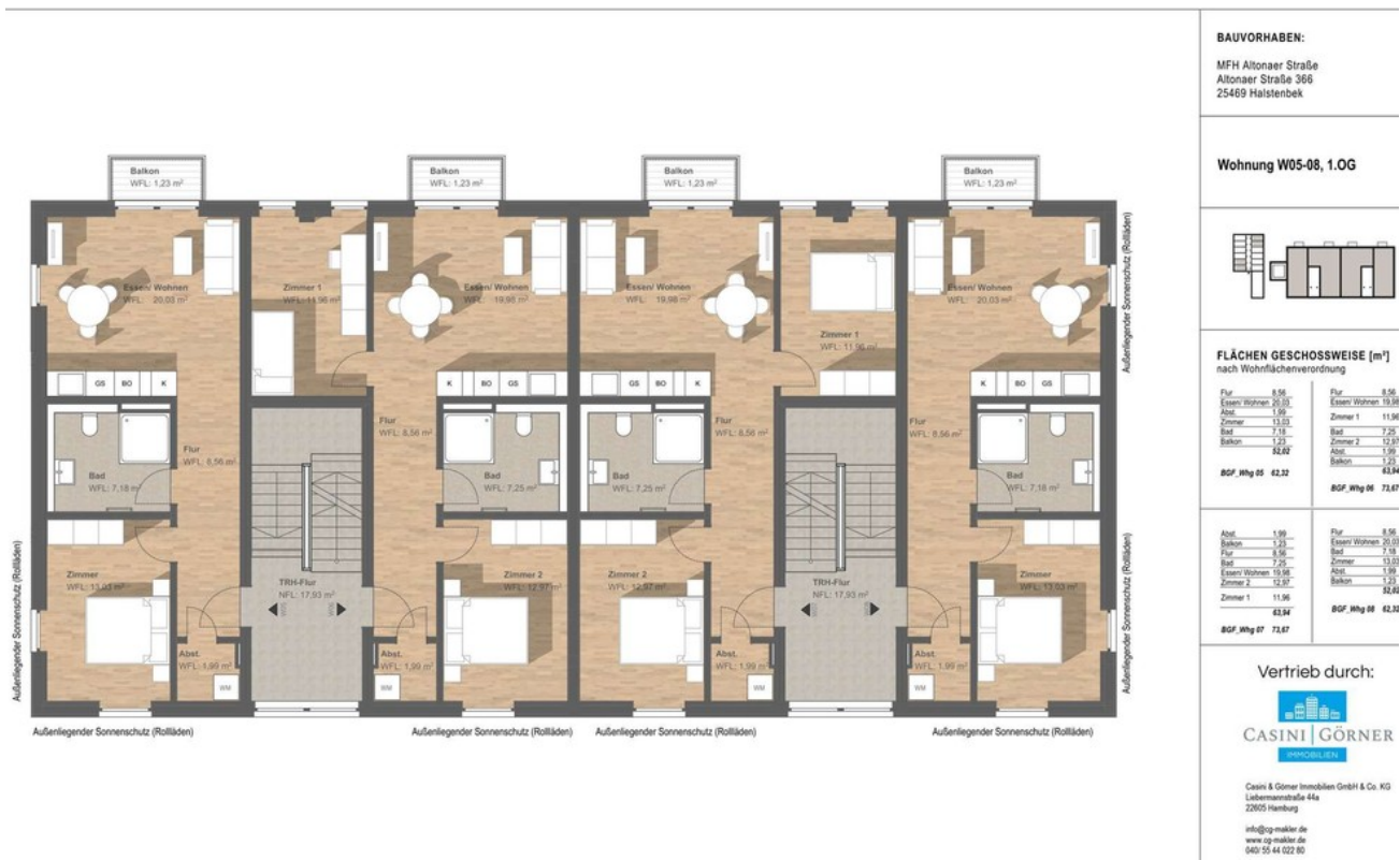
Geschossflächenplan WE5-8 1.0G