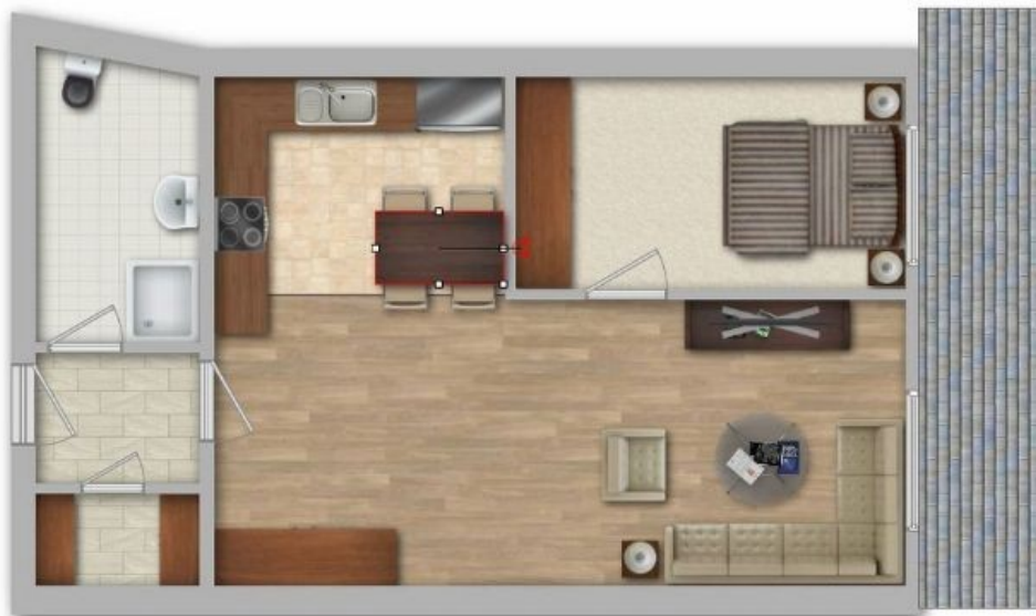
K35 - 2. OG Mitte - Grundriss nacherstellt - ohne Gewähr