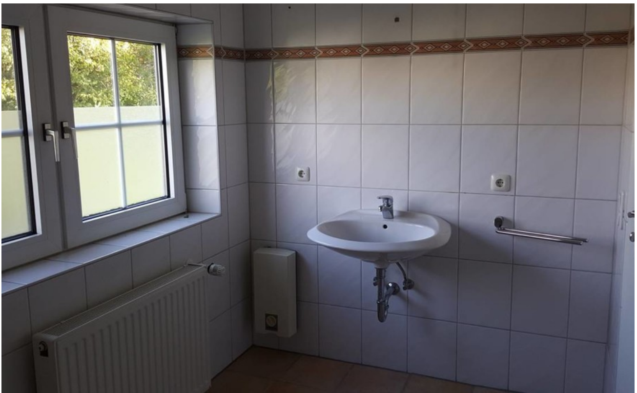
WHG 2 Bad oben rechts