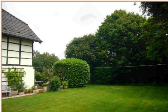
Blick in den Gartenbereich von Wohnung 2