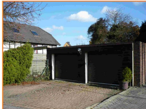
Garagen mit Stellplatz