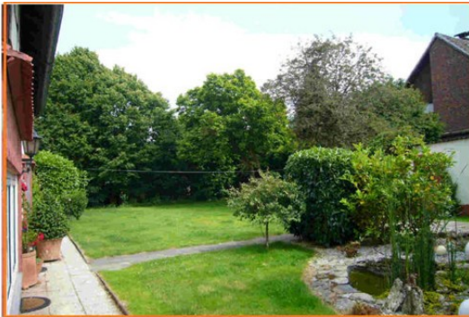
Blick vom Eingangsbereich in den Garten