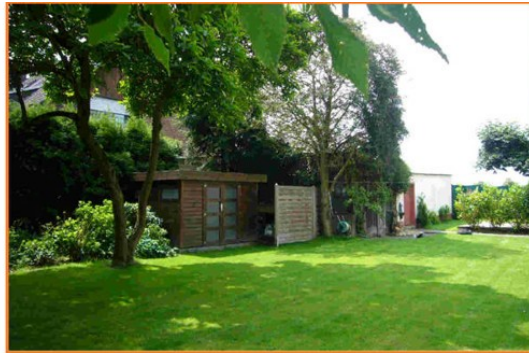
Gartenhäuschen Wohnung 1 mit Garagen