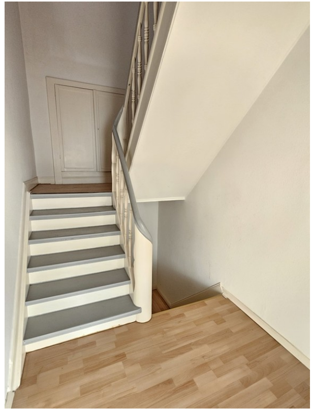
Treppe zum DG