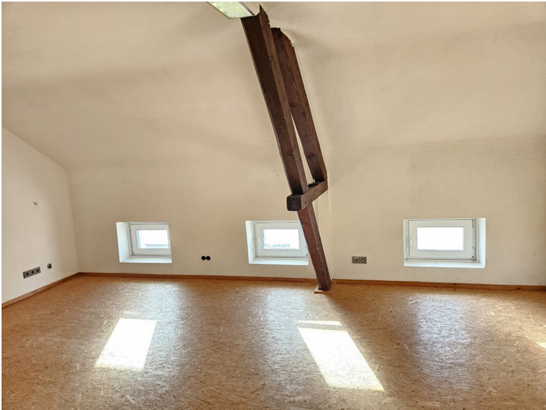
Zimmer 5 -Dachstudio