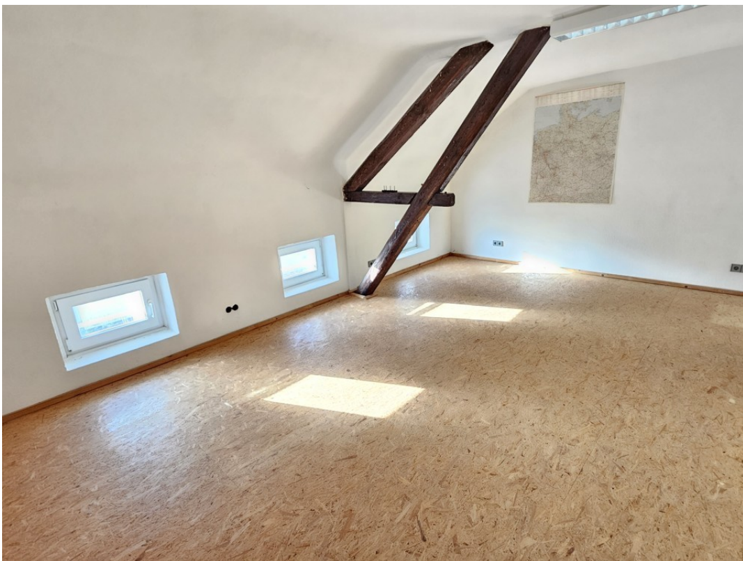
Zimmer 5 -Dachstudio