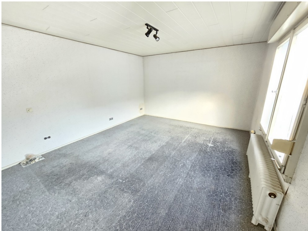
Zimmer 3 (Anbau)