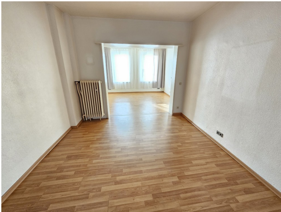
Ess- und Wohnzimmer