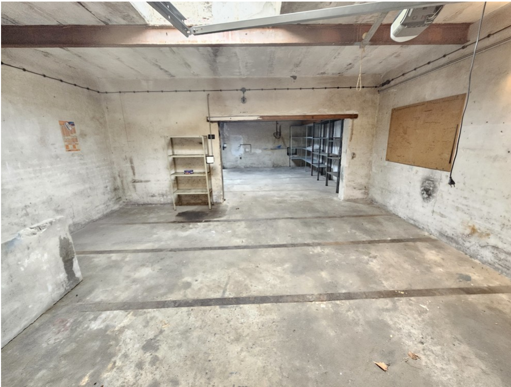
Garage und Lager