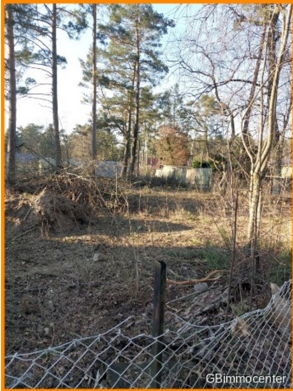
Ich bin es