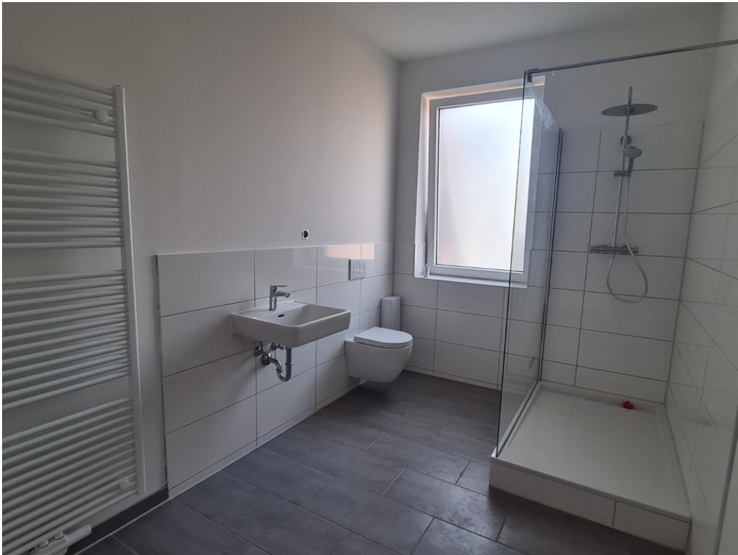
Heise Immobilien - Markt 6