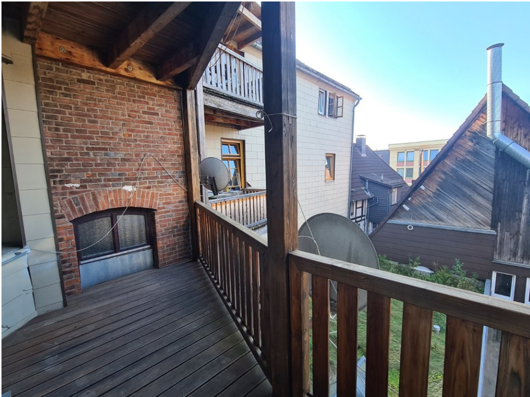
Heise Immobilien - Markt 6