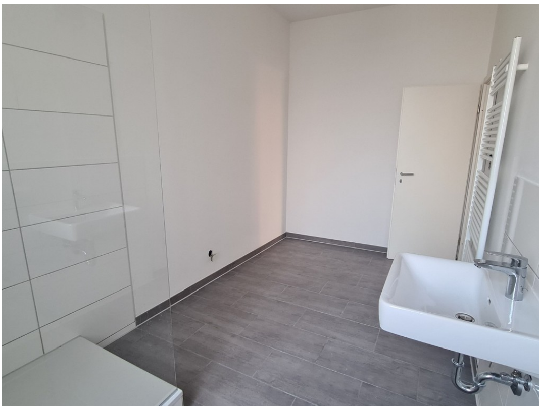
Heise Immobilien - Markt 6