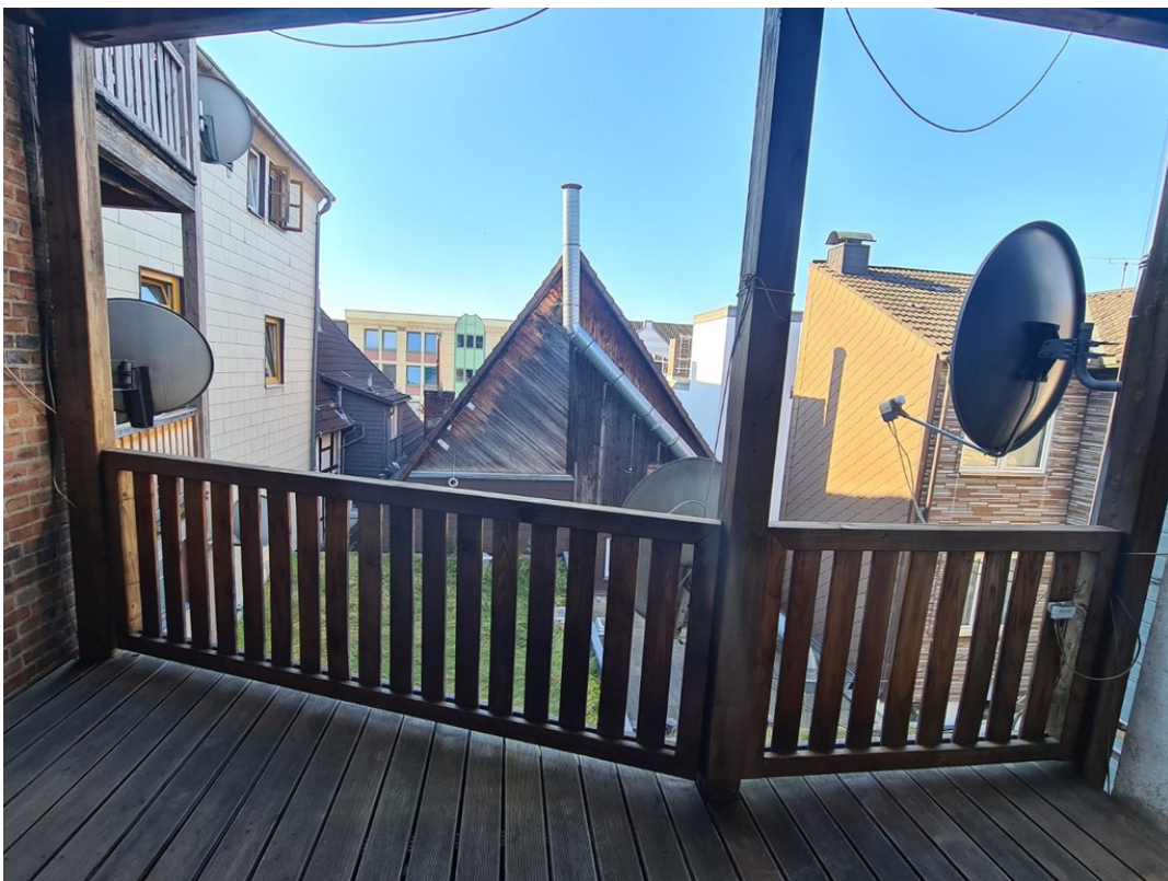
Heise Immobilien - Markt 6