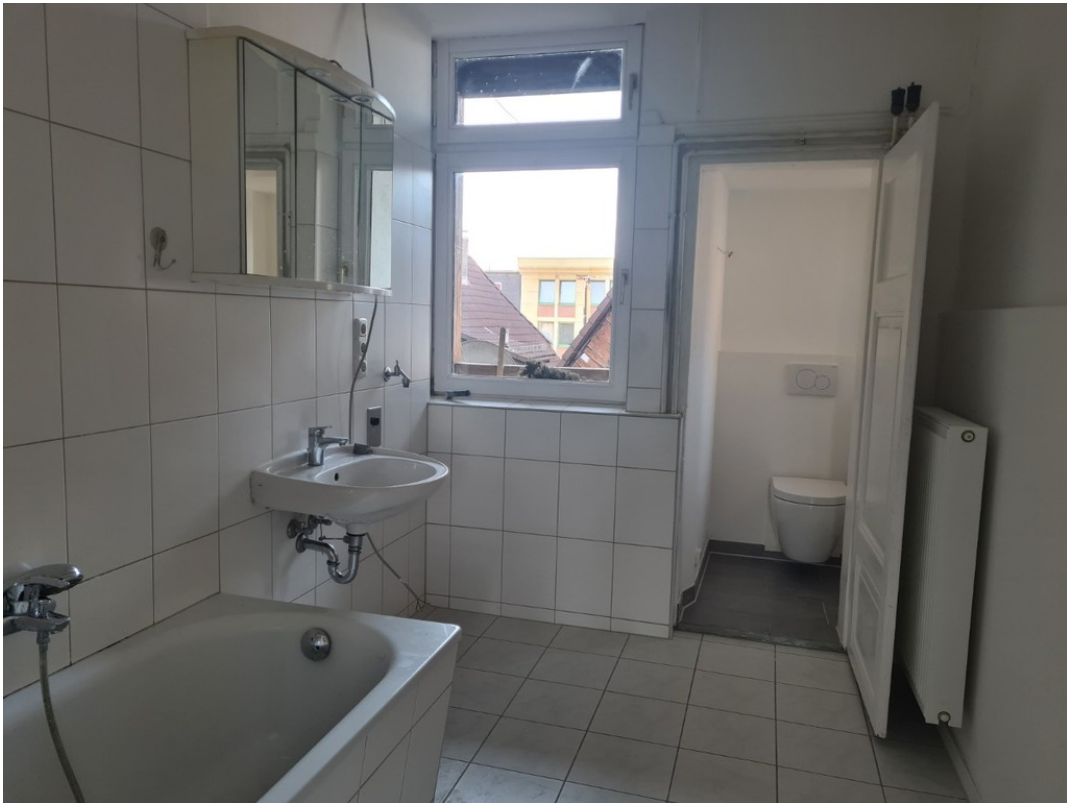
Heise Immobilien - Markt 6