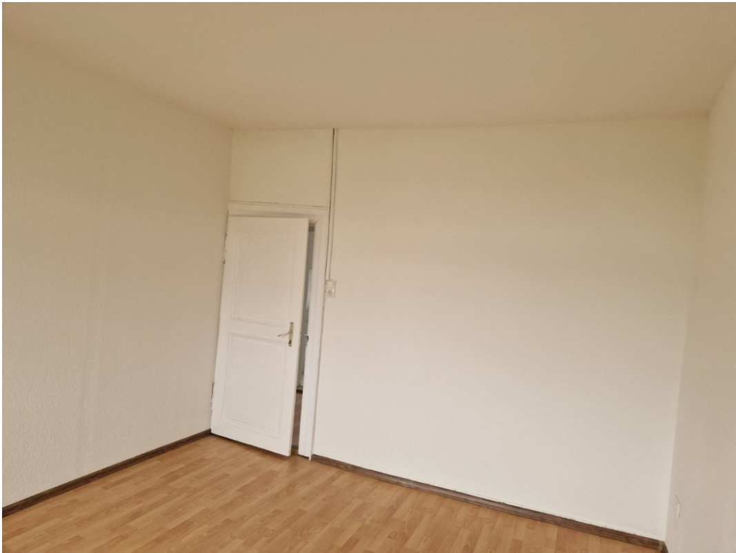
Heise Immobilien - Markt 6