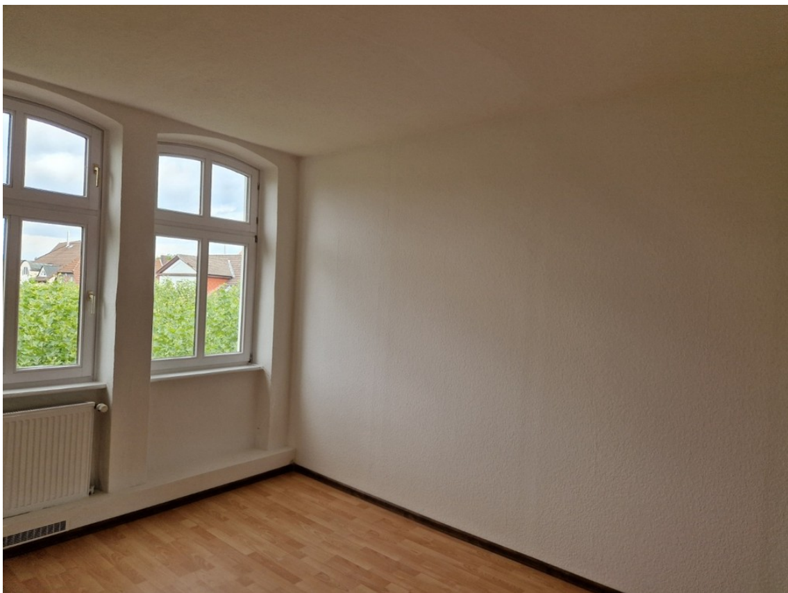
Heise Immobilien - Markt 6