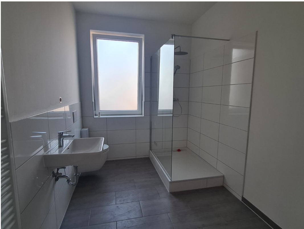
Heise Immobilien - Markt 6