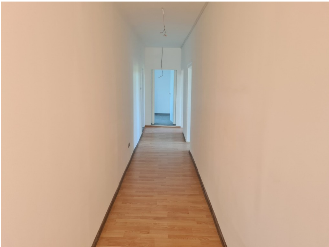
Heise Immobilien - Markt 6