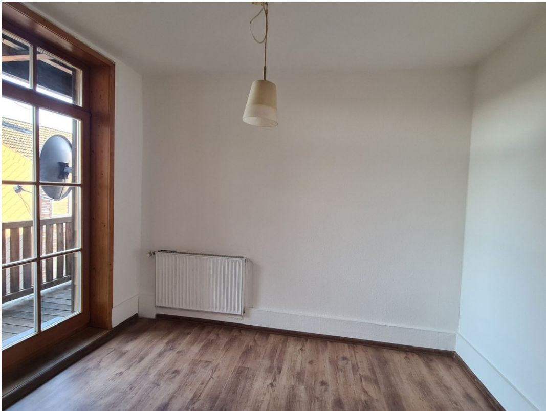
Heise Immobilien - Markt 6