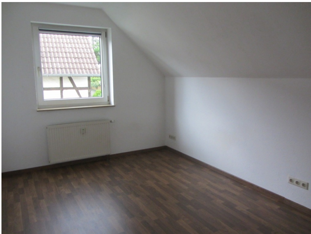
Schlafzimmer - www.immobilien-