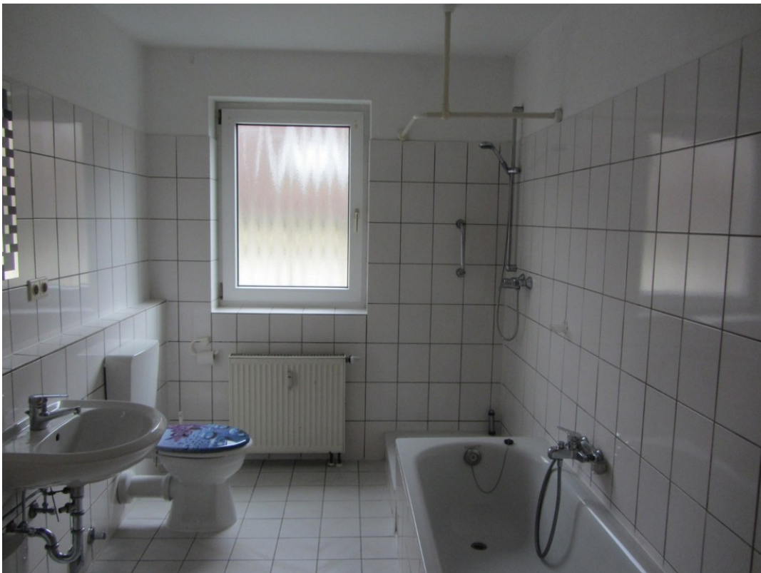
Badezimmer - www.immobilien-he