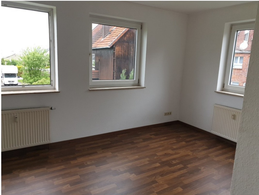
Wohn-/Essbereich - www.immobil