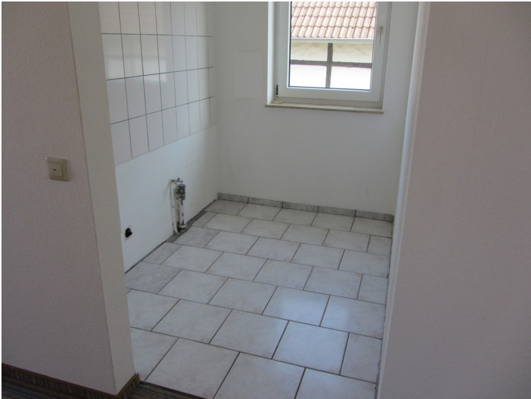
offene Küche - www.immobilien-