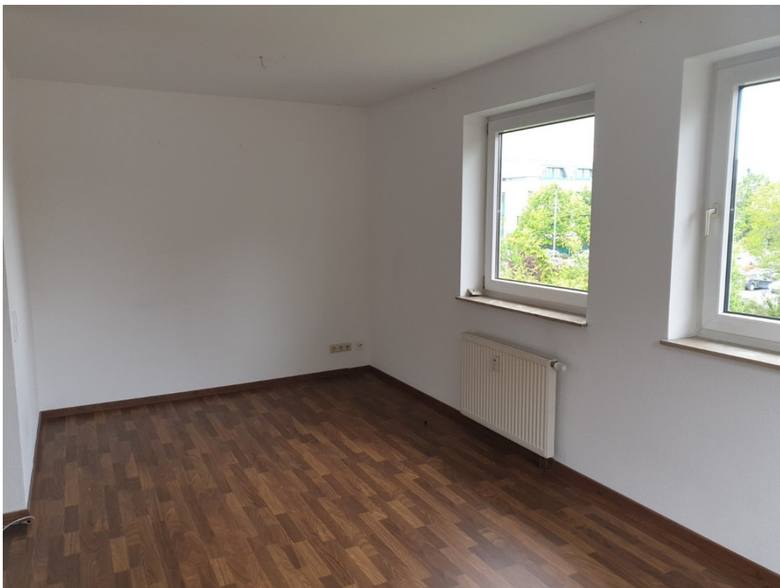
Wohn-/Essbereich - www.immobil