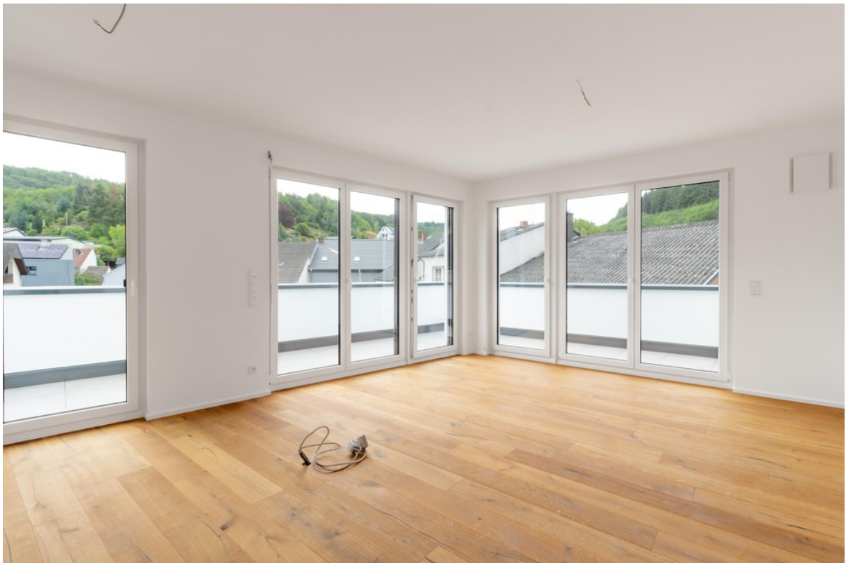
Wohnzimmer / Küche