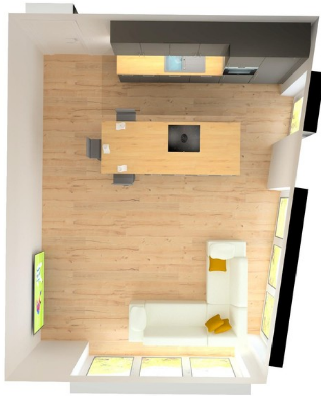
Illustration Wohnraum / Küche