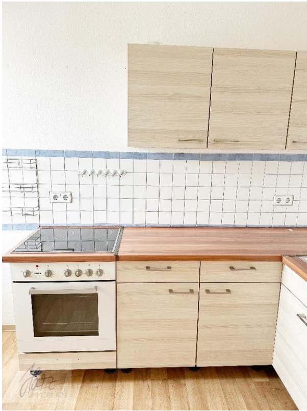
Küche mit kleiner Einbauküche