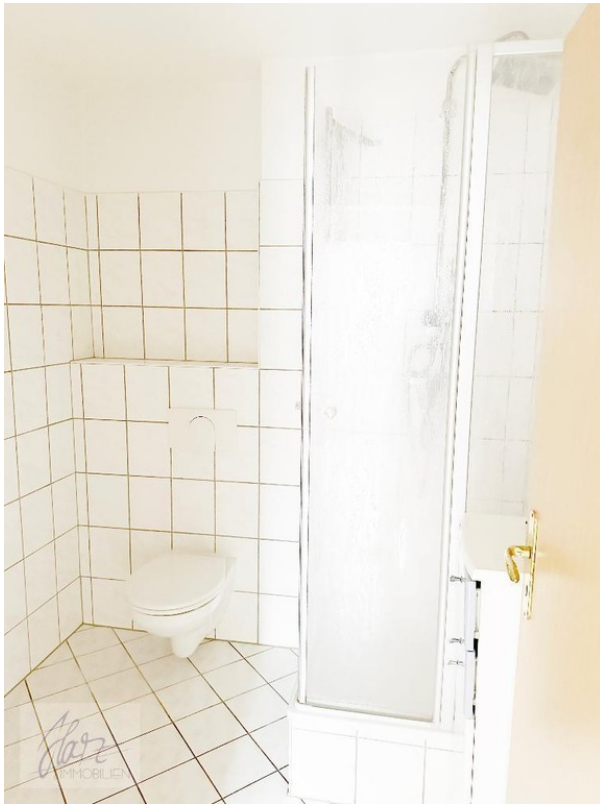
innenliegendes Badezimmer mit