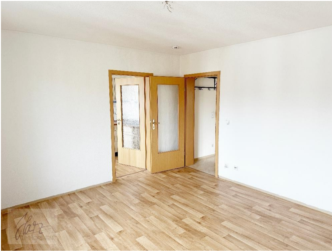
Wohnzimmer mit Blick Richtung