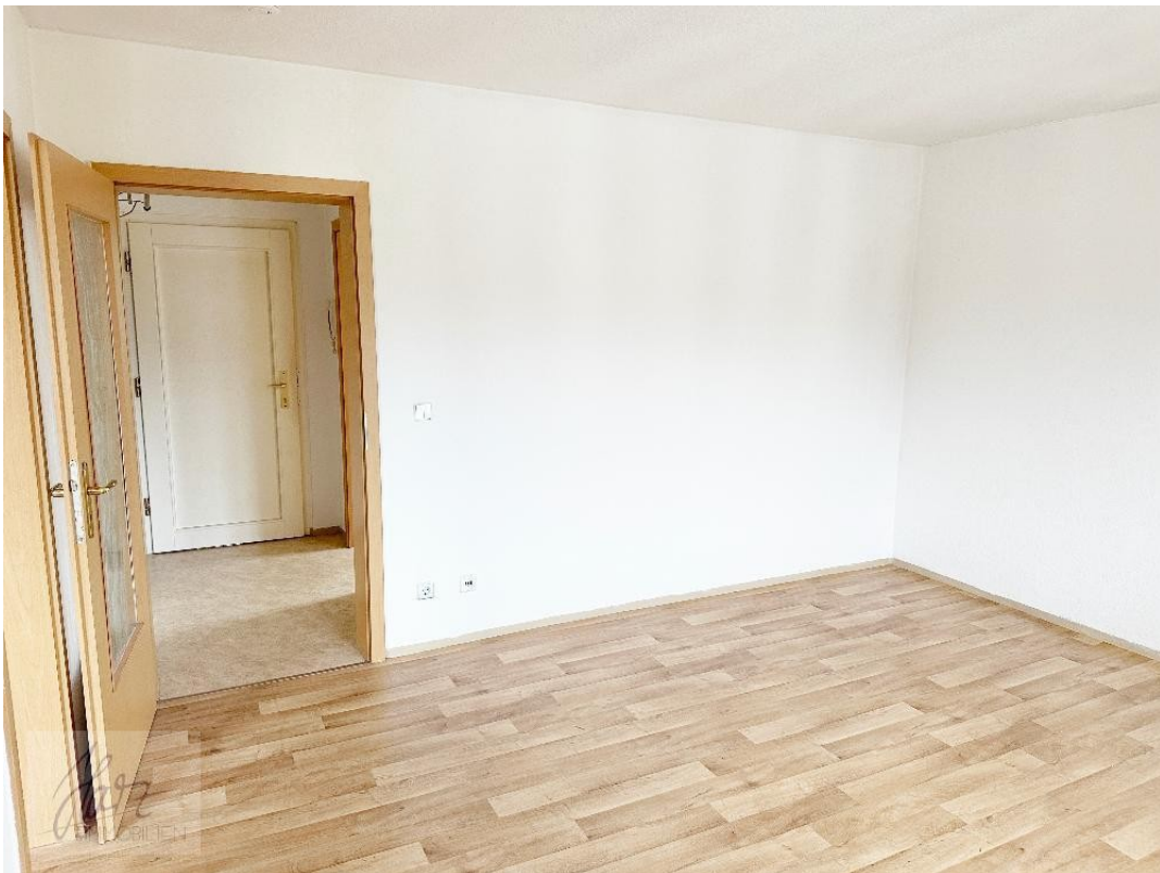
Wohnzimmer mit Blick Richtung