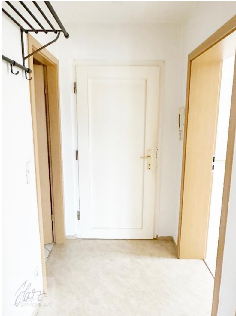
Flurbereich mit Blick Richtung