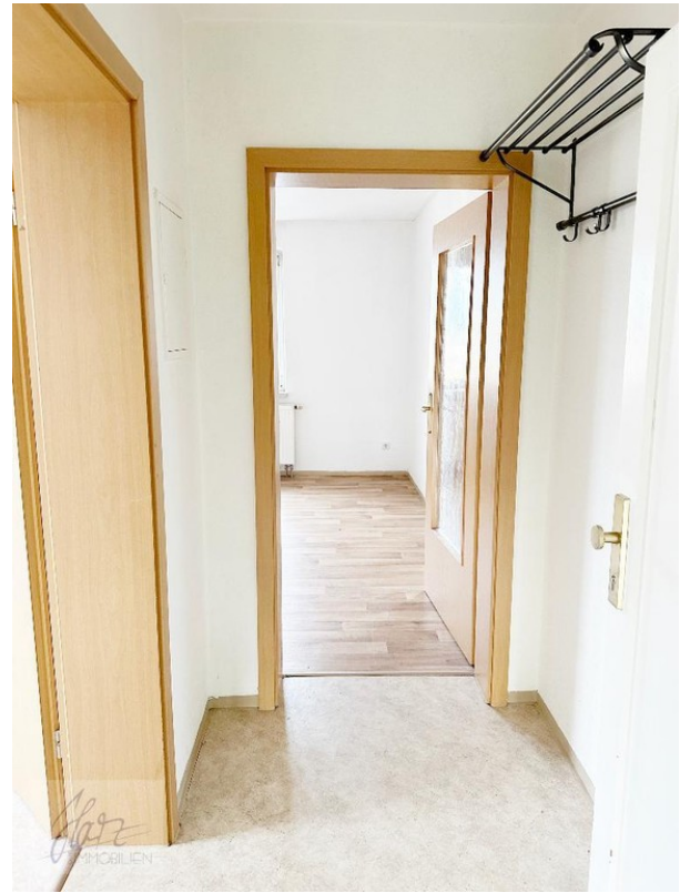
Flurbereich mit Blick Richtung