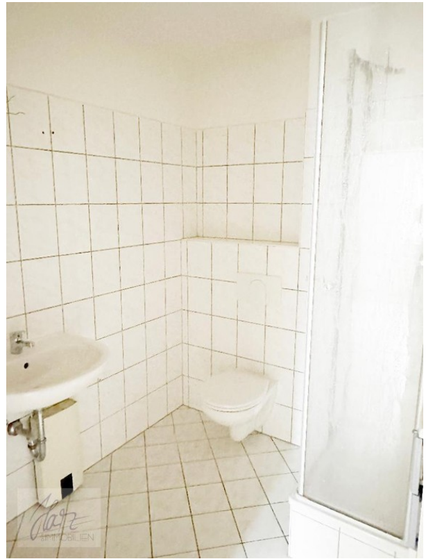
innenliegendes Badezimmer mit