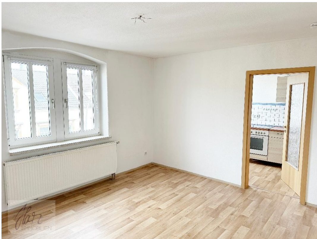
Wohnzimmer mit Blick Richtung