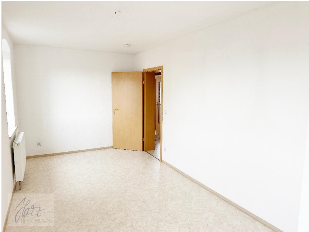
Schlafzimmer mit Blick Richtung