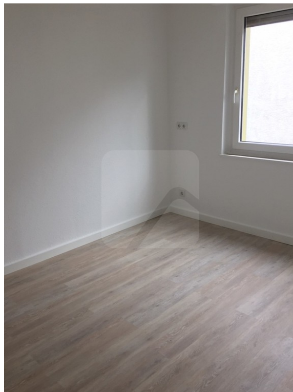
Küche linke Seite