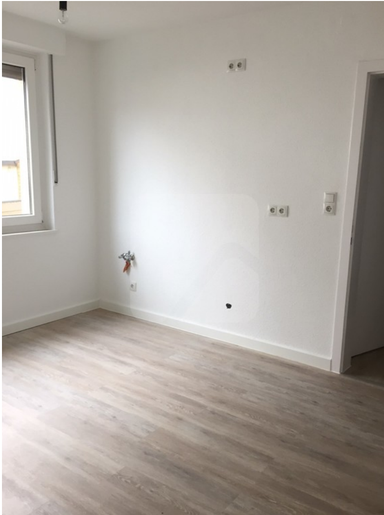
Küche rechte Seite