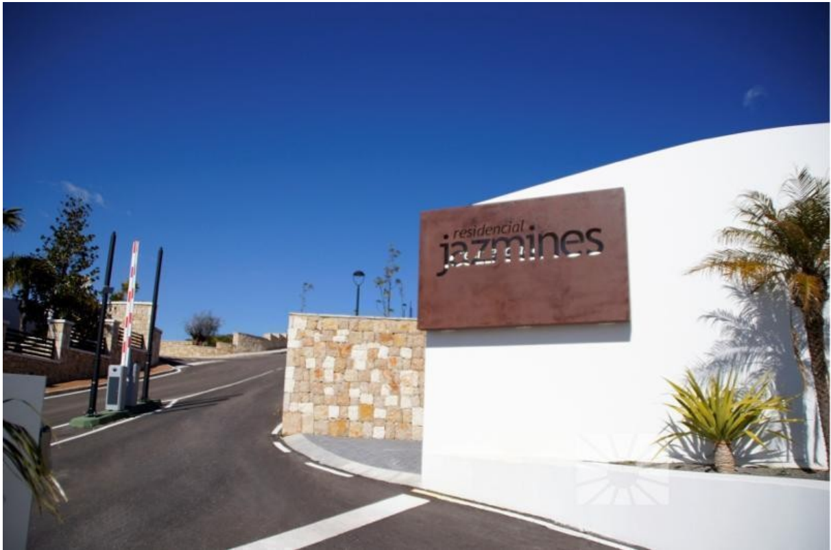
Urbanisation Bild 2