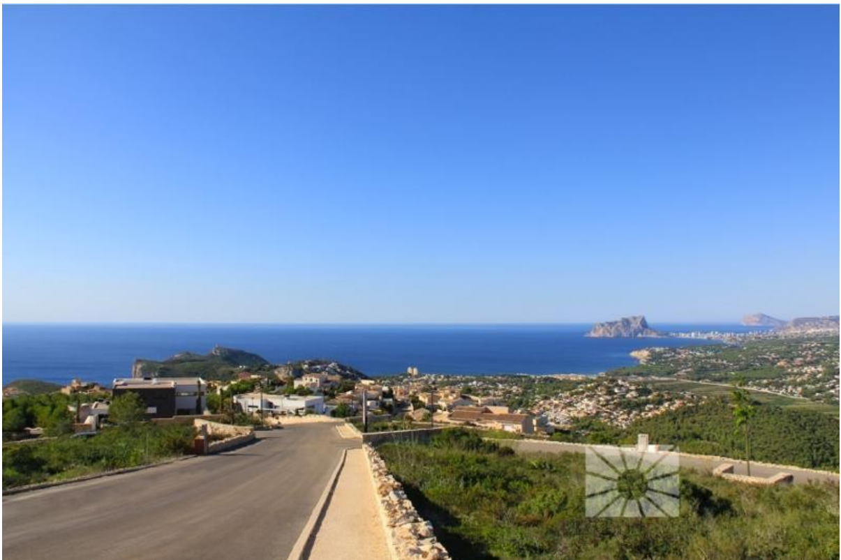
Urbanisation Bild 3