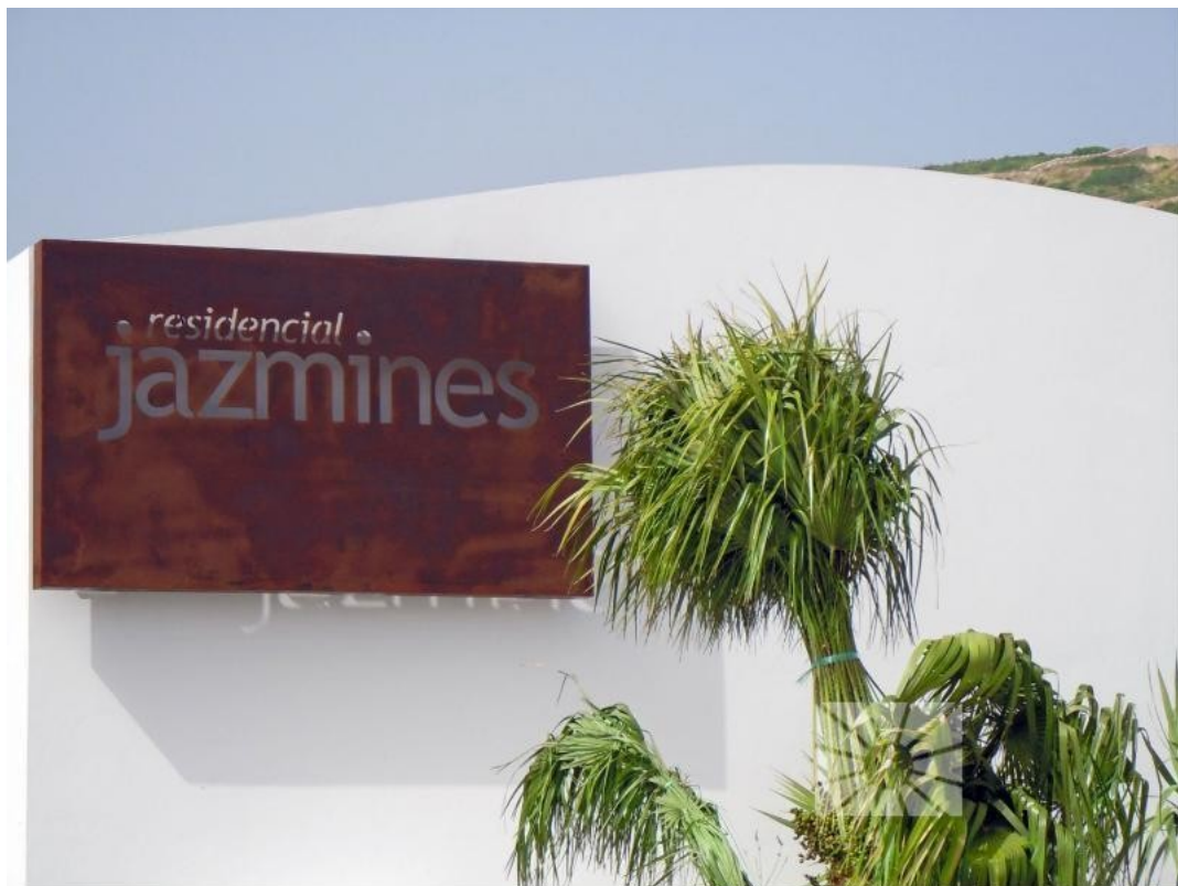
Urbanisation Bild 1