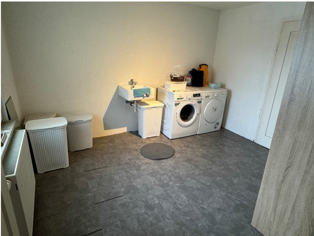
Weiteres Zimmer - Waschküche