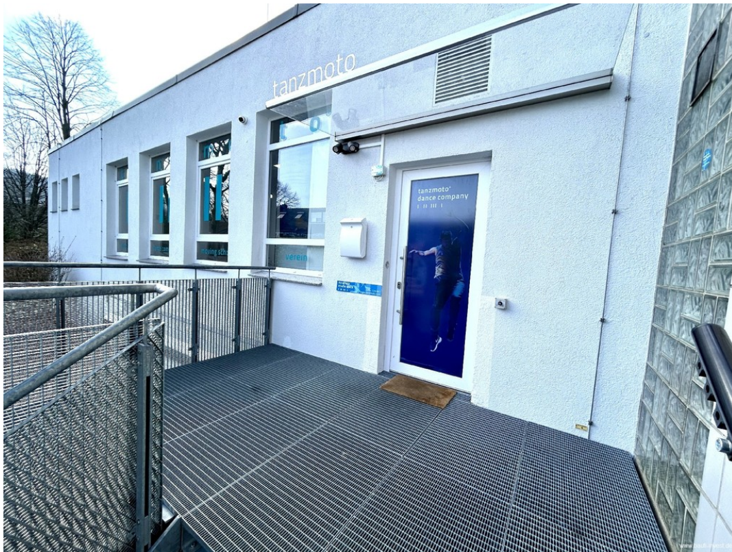
Haustür mit Terrasse