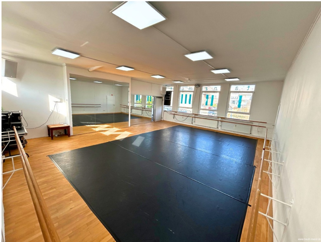
Tanzsaal mit mobilem Tanztepp