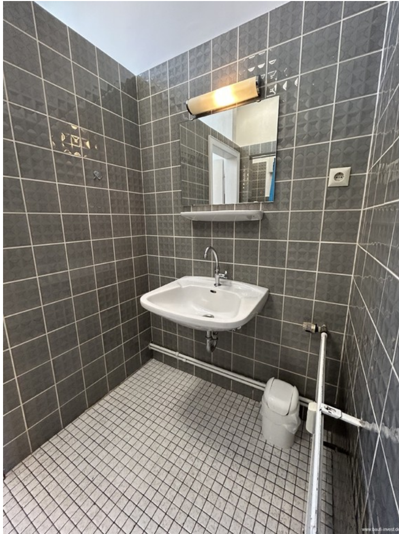
Bad mit Waschbecken