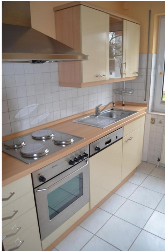
Küche mit Einbauküche