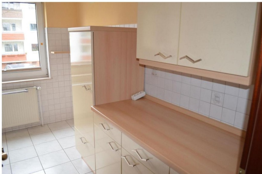
Küche mit Einbauküche