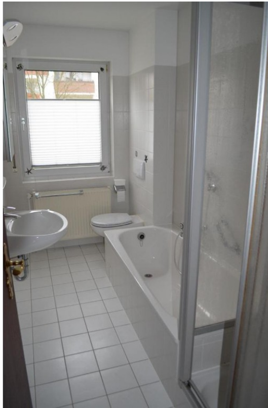
Zeitgerechtes Badezimmer mit B