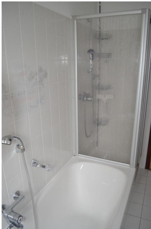
Zeitgerechtes Badezimmer mit B