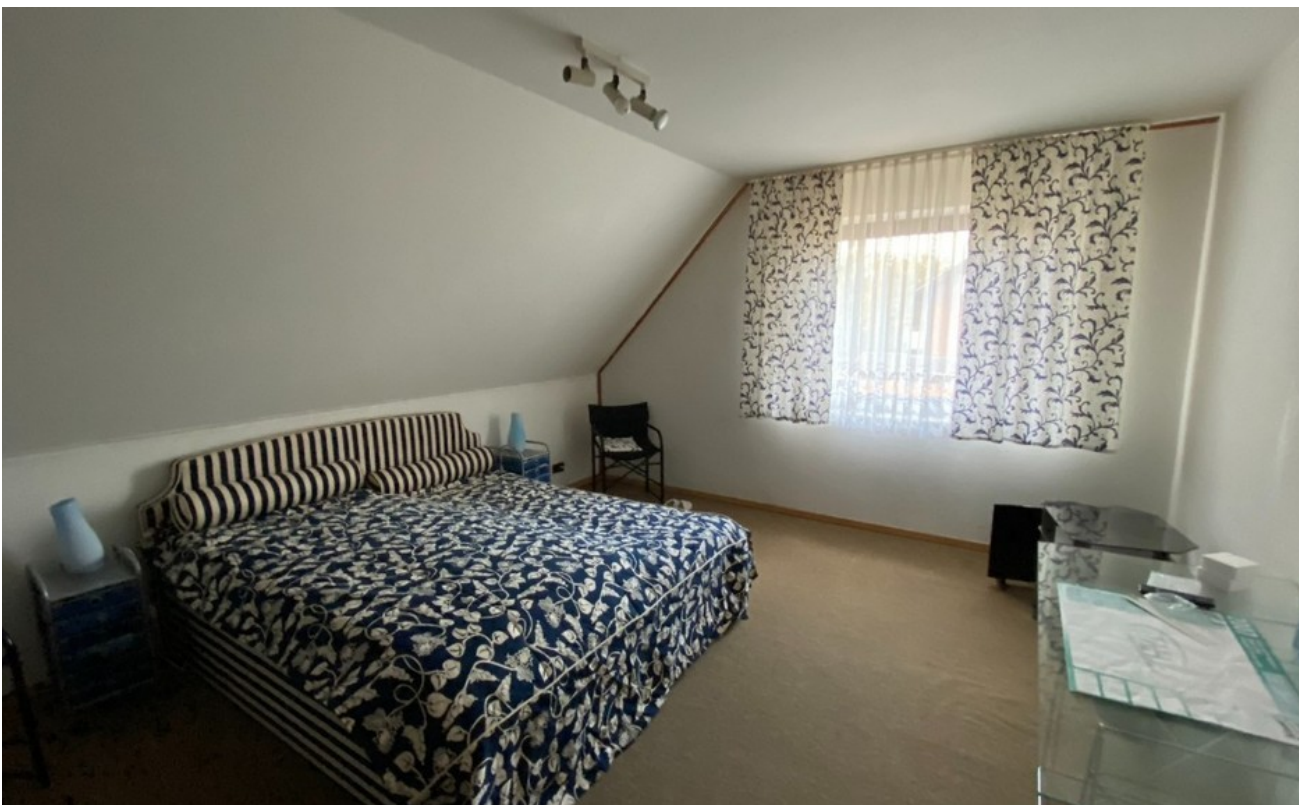
Schlafzimmer - www.immobilien-