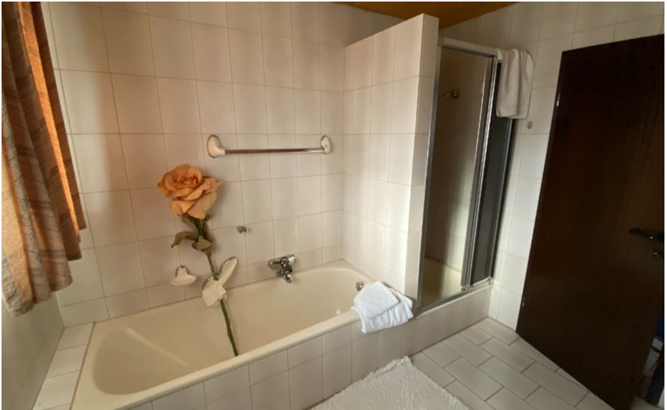
Bad - www.immobilien-heise.de