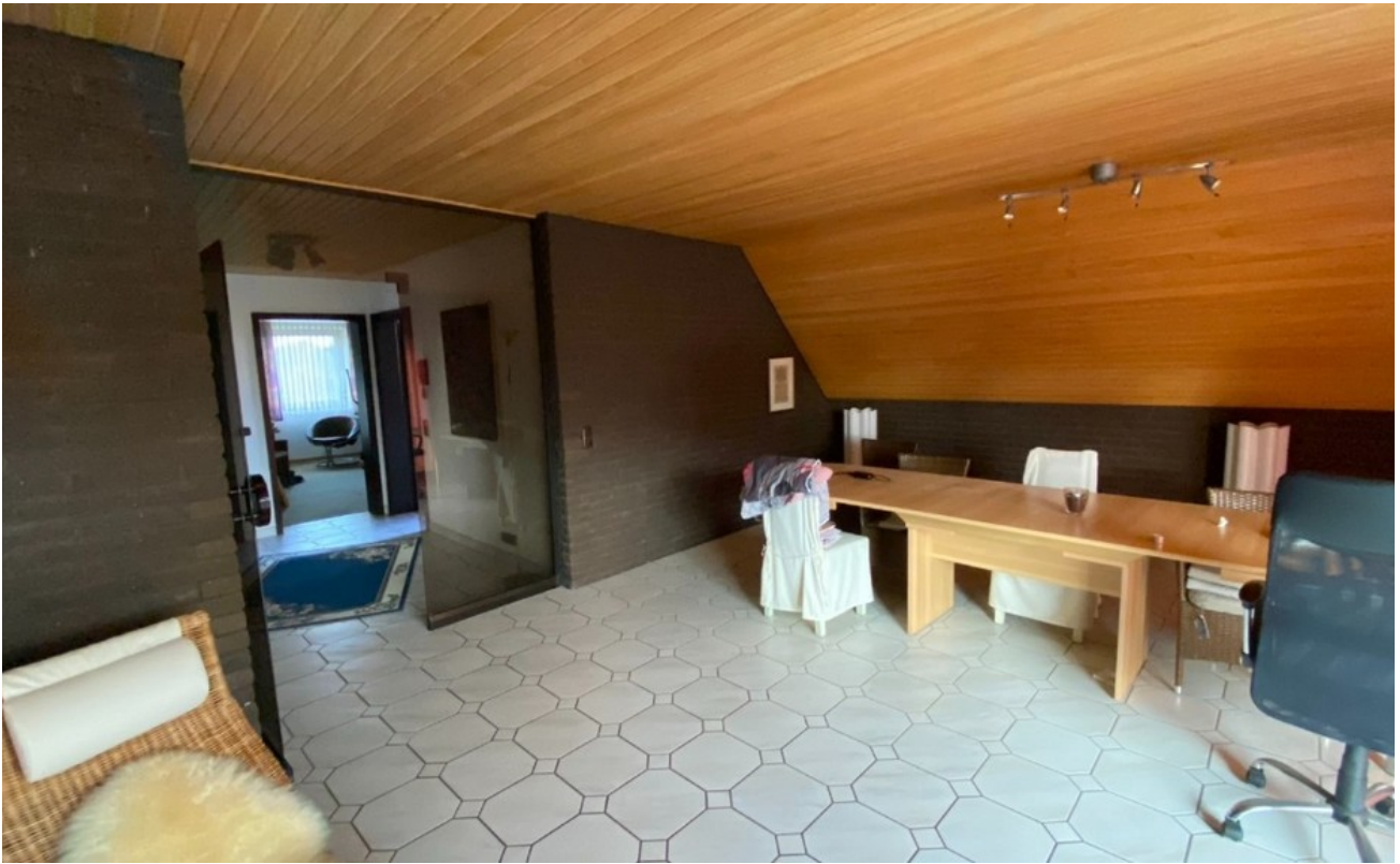
Wohnzimmer - www.immobilien-he