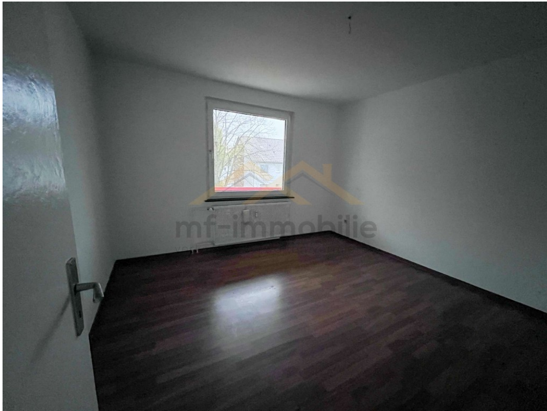
Wohnung Berliner Ring-06