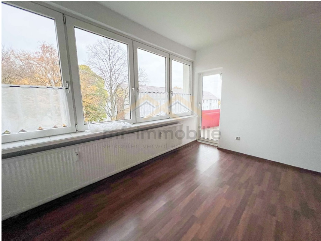
Wohnung Berliner Ring-04