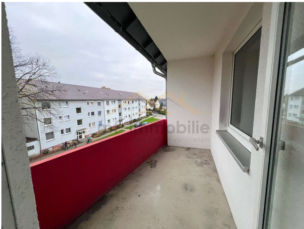
Wohnung Berliner Ring-03