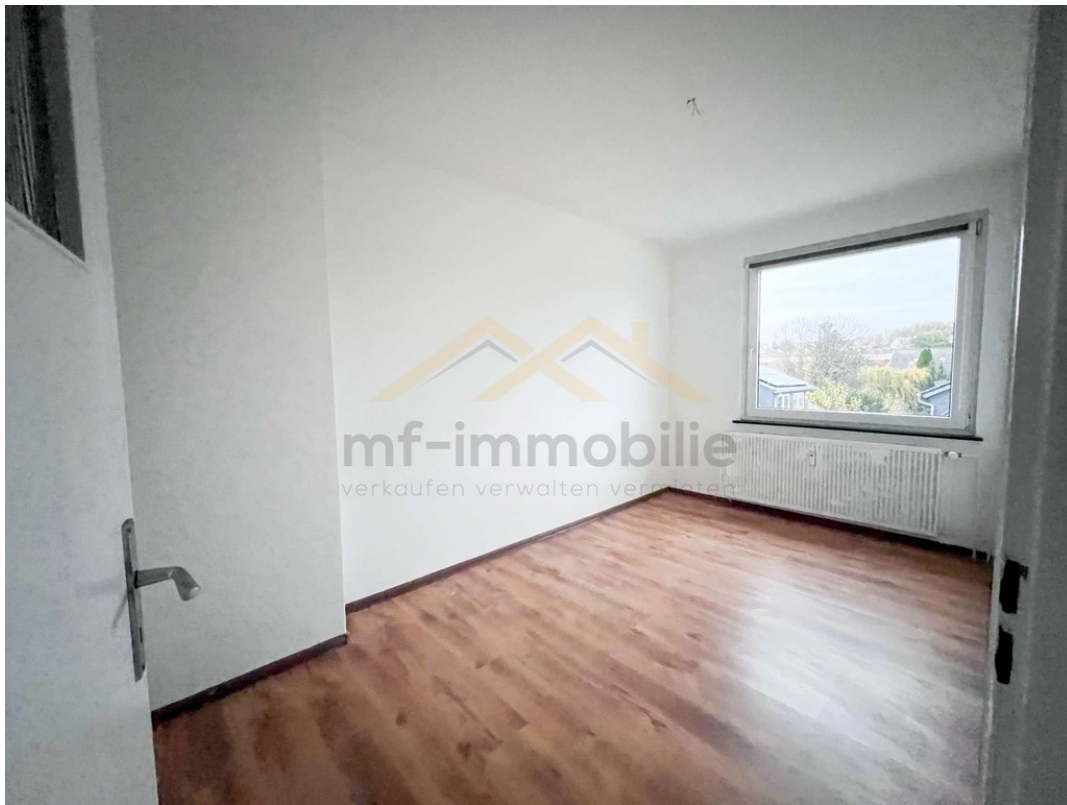
Wohnung Berliner Ring-10