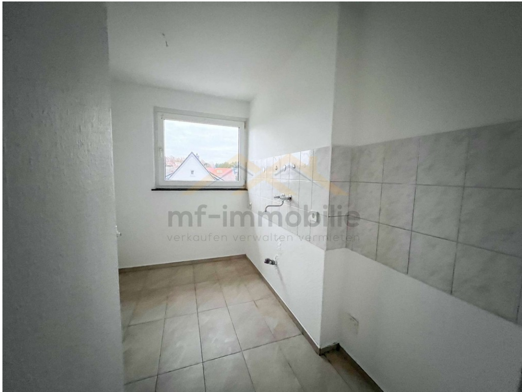
Wohnung Berliner Ring-12