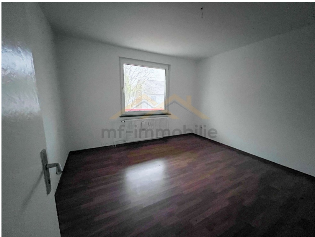
Wohnung Berliner Ring-07