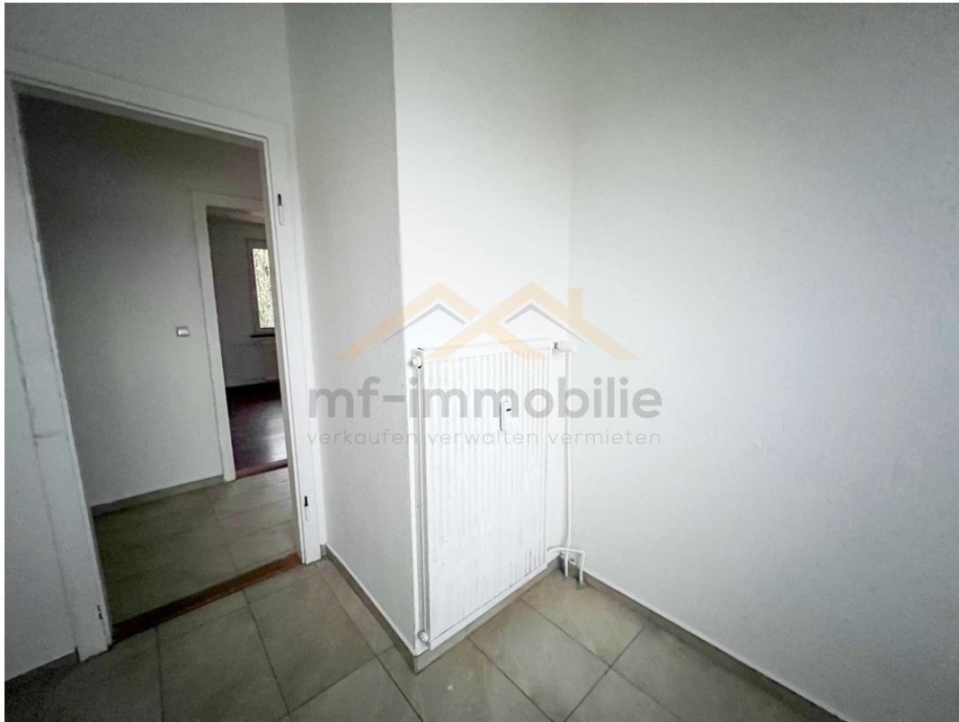
Wohnung Berliner Ring-08