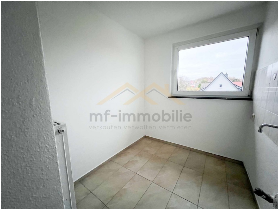
Wohnung Berliner Ring-11