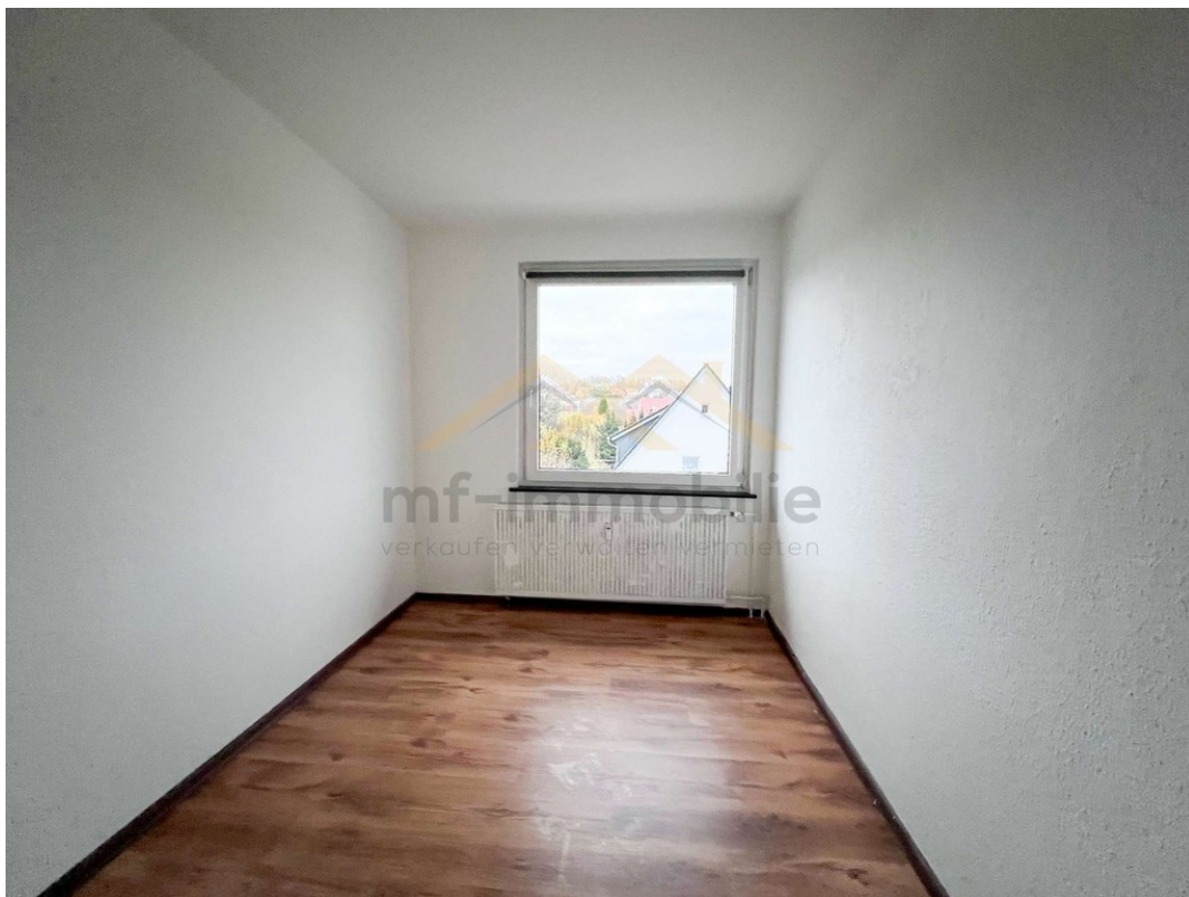
Wohnung Berliner Ring-09