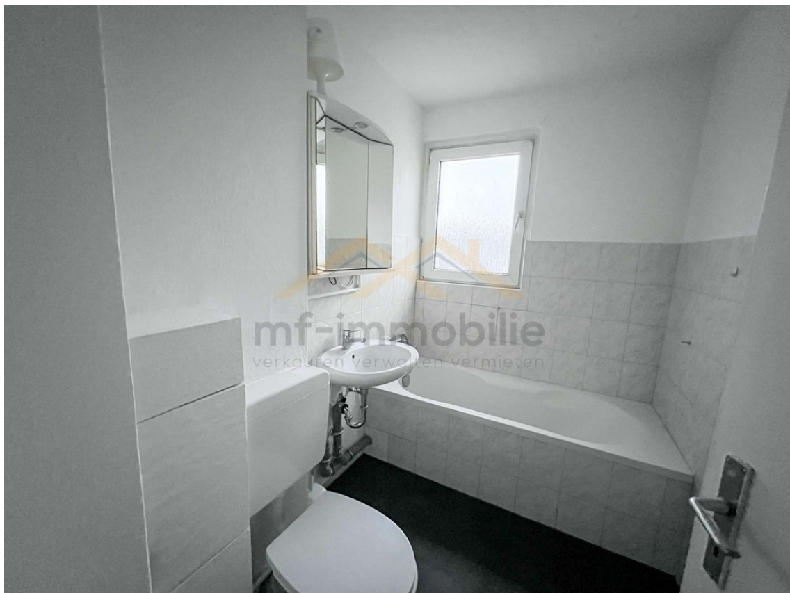
Wohnung Berliner Ring-14