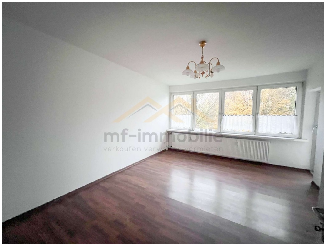
Wohnung Berliner Ring-05