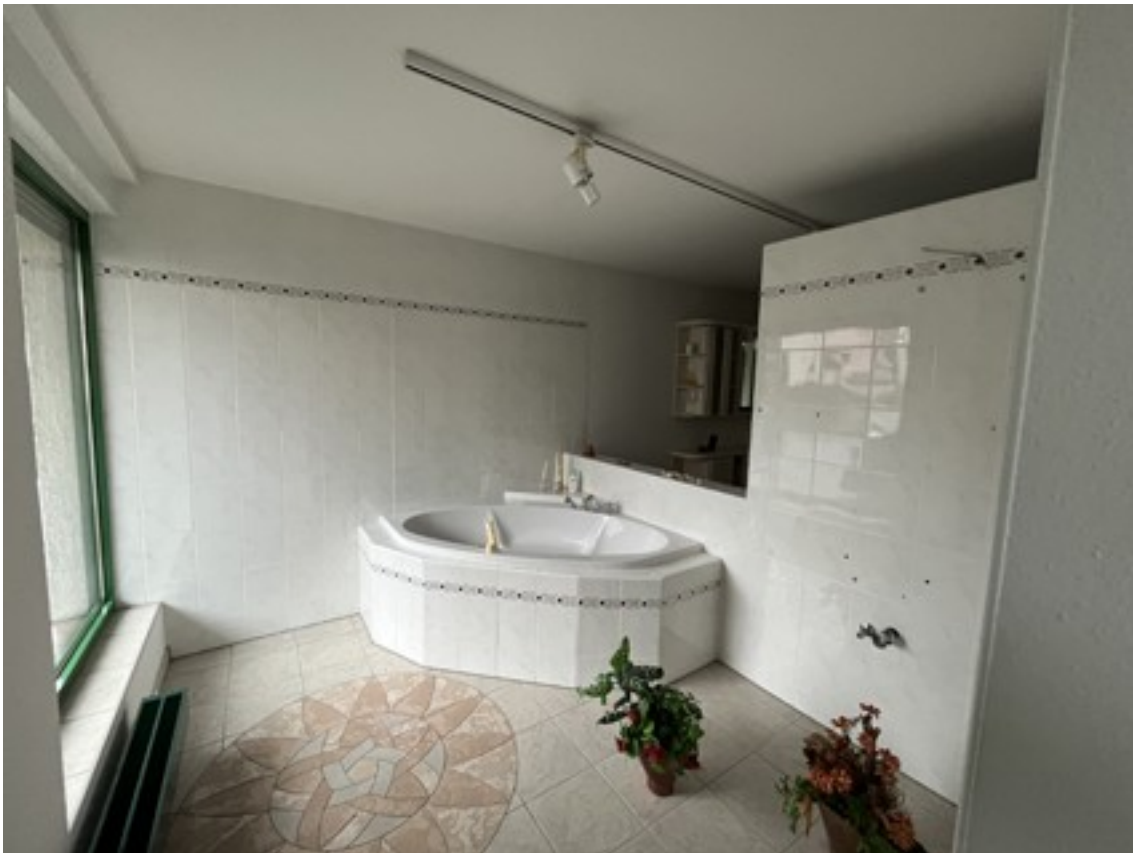
Schauraum im Erdgeschoß