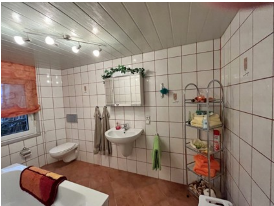
Zweites Bad im Anbau